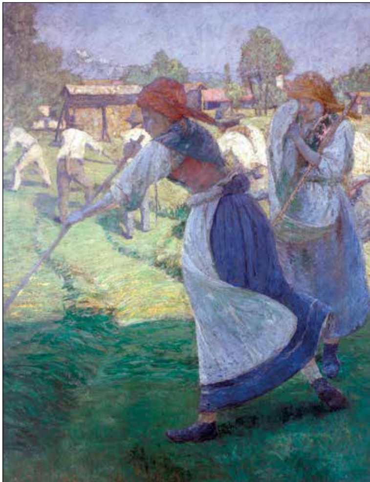
Ivan Grohar, Grabljice (tudi: Ob košnji ), (1902); olje/platno, 133,5 x 107,5 cm; Muzej in galerije mesta Ljubljane.