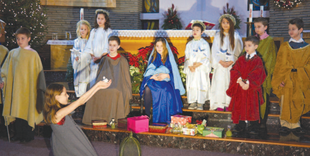
Otroci pri božičnici v Hamiltonu

postavile napis z imenom in priimkom članice.