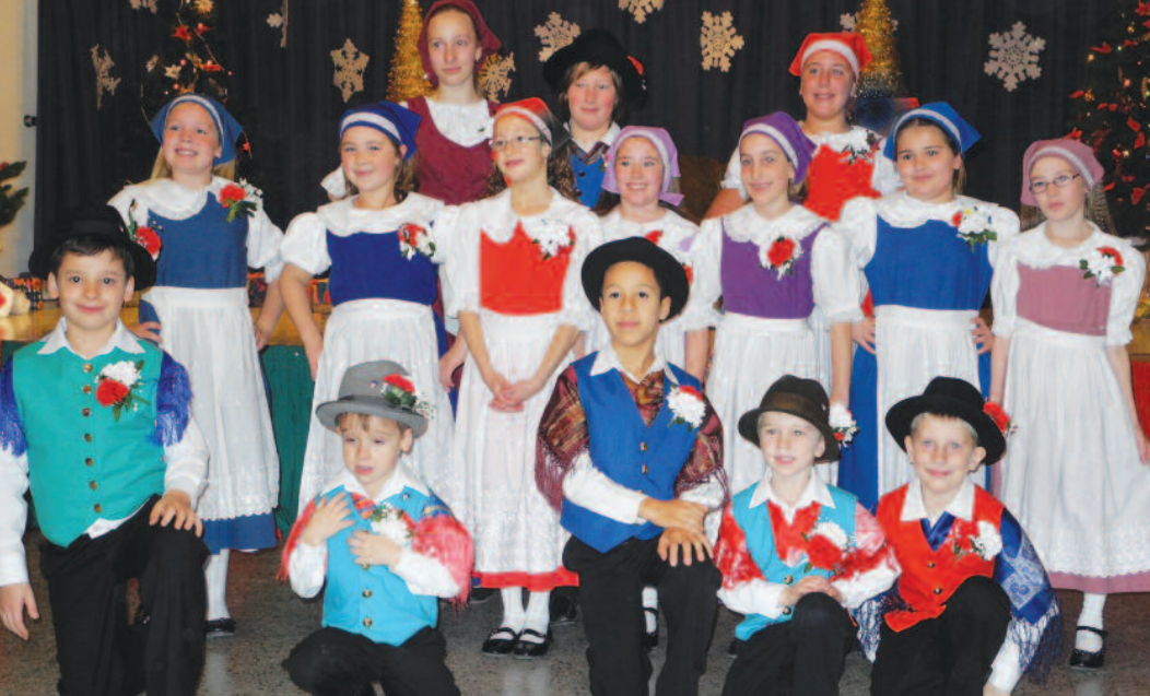
Otroci na Miklavžev večer v Montrealu

tako kratkem času pripravi tako dobra in izvrstna hrana iz tako navadnih stvari kot so repa, ajda, proso in svinjsko meso. Razpoloženje je bilo prav prijetno domače, k čemur so pripomogli naši mladi muzikanti, ansambel Pachenka. Po večerji je bil tudi srečolov. Ko so gostje videli lepe in bogate dobitke, so z veseljem kupovali listke in mnogi so bili nagrajani z lepim darom.