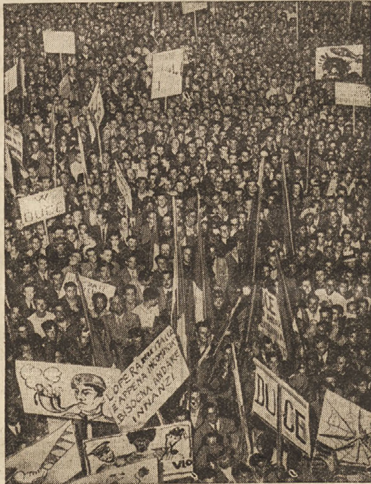
V Italiji se vedno manifestirajo za vojno proti Abesiniji. Na lepakih so med drugim tudi ostri napadi proti Angliji in Japonski.

Na Angleškem letališču Heston so ravnokar predvajali nov avijon, ki stane 90 funtov (19.000 dinarjev). Če bodo poskusi uspeli, bodo avijone izdelovali v masah. Na sliki vidimo malega kliputanca poleg svojega orjaškega sodruga.