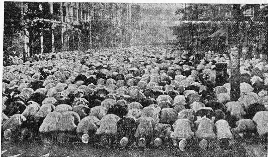
Na ulici mesta Kalkute so bili mohamedanci na njihov praznik takole zbrani v molitvi. V Evropi takšnih prizorov seveda ni...

Ta francoski zdravnik je vedel povedati tudi precej o neki posebni duševni tropski bolezni, ki jo je imenoval »Snežna bolezen«. Pojavila se je pred nekaj leti v Tonkingu in v Francoski Indokinii. Takrat je bilo tam nekaj Evropejcev, povetini iz alpskih pokrajin, ki so še tam neprestano fantazirali o snegu, o lepem, belem, čistem, mrzlem snegu, kakršen pada v njihovi evropski domovini, in ki bi ga spej že enkrat tako radi videli. Teh ljudi se je polastila težka mrzlica. Dva sta celo umrla, tretjega pa so še v zadnjem trenutku hitro prepeljali v gorsko pokrajino, kjer je včasih padlo vsaj nekaj snega. In nekaj dni pozneje je tam tudi res snežilo. Bolnik je ležal ob oknu in gledal sne-