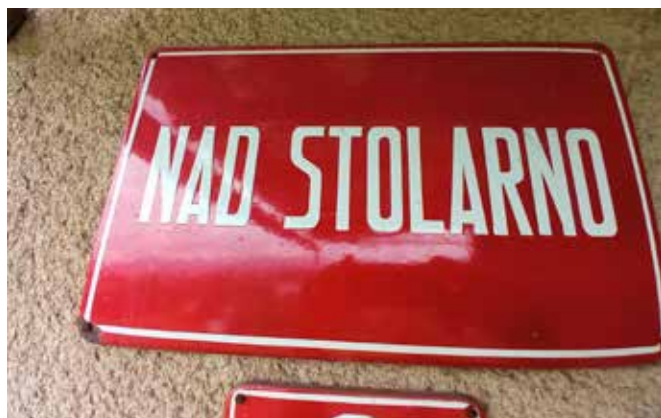
Tabla ulica Nad Stolarno