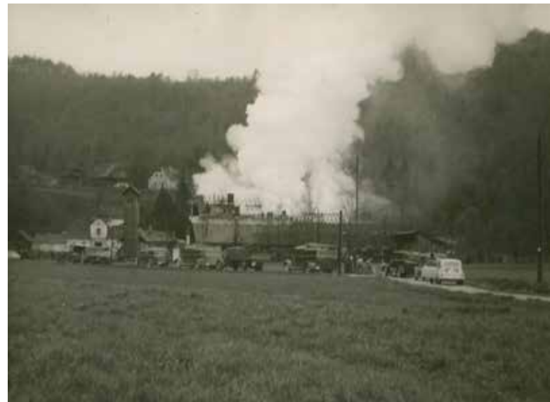
Požar aprila leta 1958, ki je uničil Stolarno