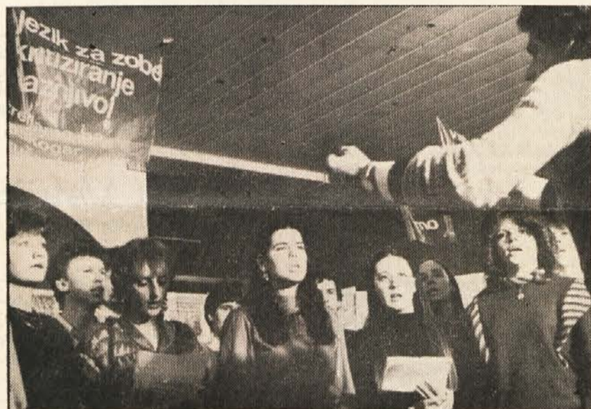
Na kulturnih dneh se je predstavil Klub slovenskih študentov in študentk na Dujanju, ki letos slavi 60-letnico svojega obstoja. Zapel je tudi klubski zbor.

sosede, ki smo jih vedno zavračali in za katere v sedanji situaciji nimamo nobenega vzroka, da bi jih odobrvali. Še vedno je v deželi mnogo prezirna osnovnih potreb slovenske narodne skupnosti, ki ga trenutno občutimo predvsem na šolskem področju, čeprav v določenih krogih večinskega naroda raste potreba po uporabljanju slovenske oz. po dvojezičnosti. Ko je predsednik ZSO ocenjeval možnosti našega delovanja v prihodnjem letu, je navezoval na pozitivne dogodke minulega leta, ter omenil uspešno delovanje skupnega gospodarskega odbora koroških Slovencev, napredovanje pri naporih za ustanavljanje še drugih dvojezičnih otroških vrtcev, na napredke Slovenskega vestnika pri razširjanju kroga sodelavcev, predvsem pa je poudaril, da bo ob ponovni stritvi sil naše organizacije v prihodnje treba uveljaviti bolj funkcionalno delovanje naših odborov v korist slovenske narodne skupnosti na Koroškem.