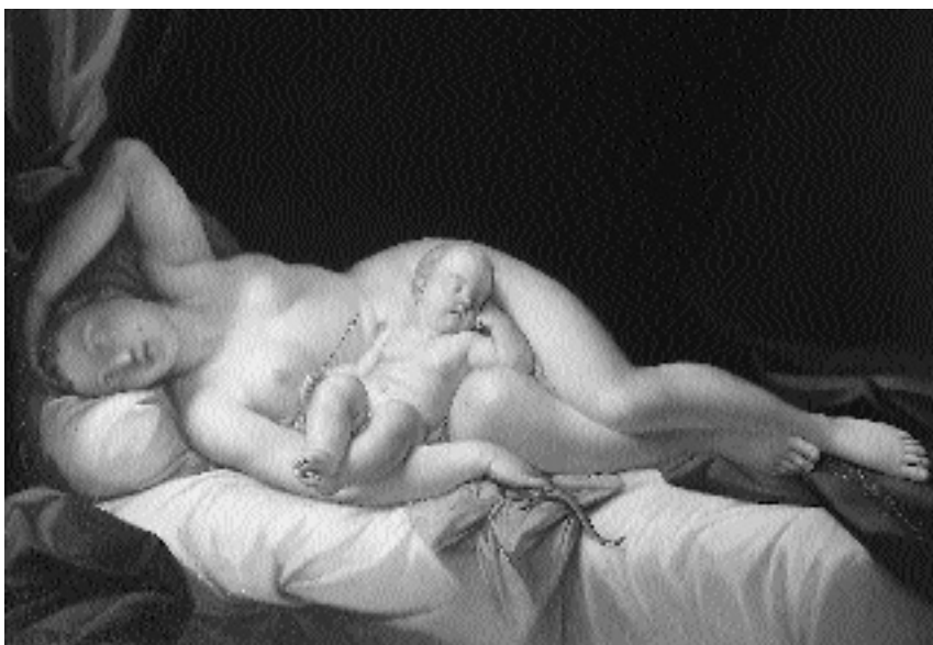
5. Gioachino Serangeli, krog: Speča Venera s Kupidom , naprodaj v Dorotheumu, Dunaj, 2. junija 1993