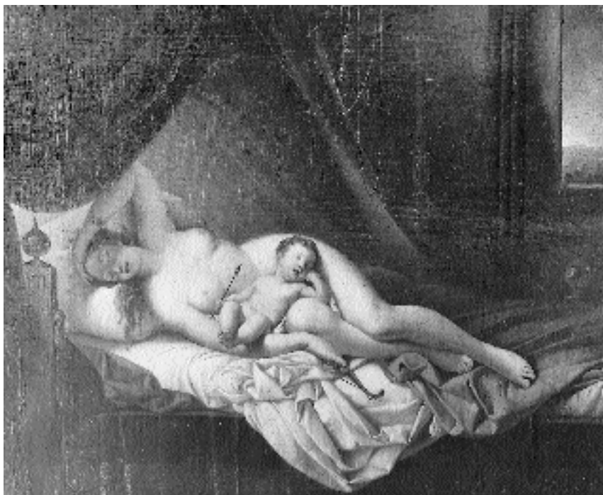
1. Jožef Tominc: Venera in Kupido , Gorica, Musei Provinciali, Palazzo Attems

zlasti na sramnem delu. 2 Tja je Franceschini namestil spečega Kupida.