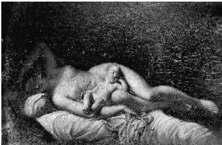
3. Giuseppe Carlo Pedretti: Venera in Cupido , Budimpešta, Szépművészeti Múzeum