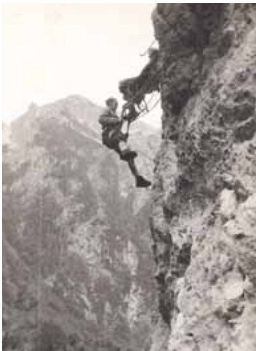
Vaja z reševalnimi nosili v steni Sivnice