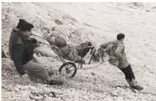
Reševanje izpod Skute z reševalnimi nosili in kolesom