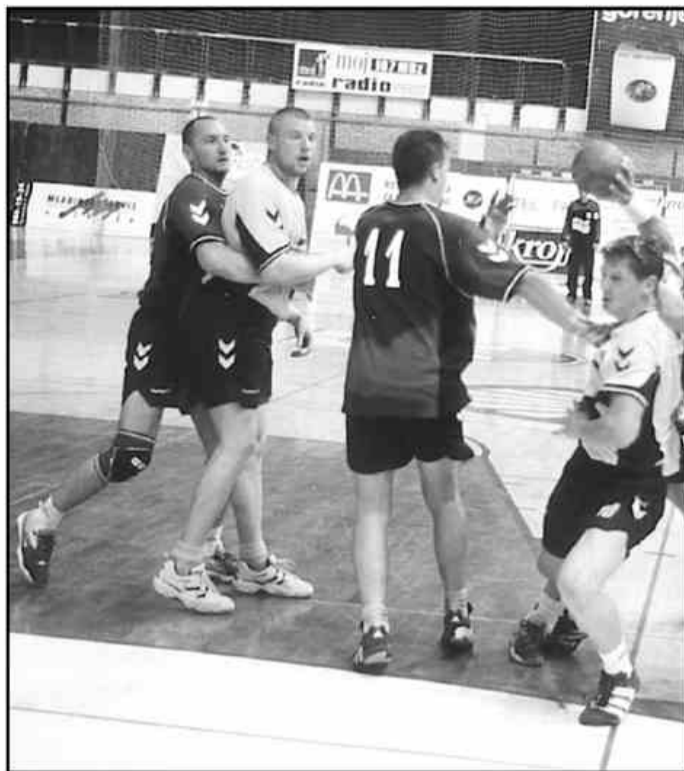
Večji del tekme so domači brez težav zadevali.

"Seveda bi bil bolj vesel visoke zmage. Toda na koncu, po nekaterih menjavah, igra ni več tekla po moji želji. Ni bilo več prave discipline, igralci so prehitro zaključevali akcije, vsak je igral zase in ne za kolektiv. Posledica tega bila zmaga le z dvema zadetkoma."