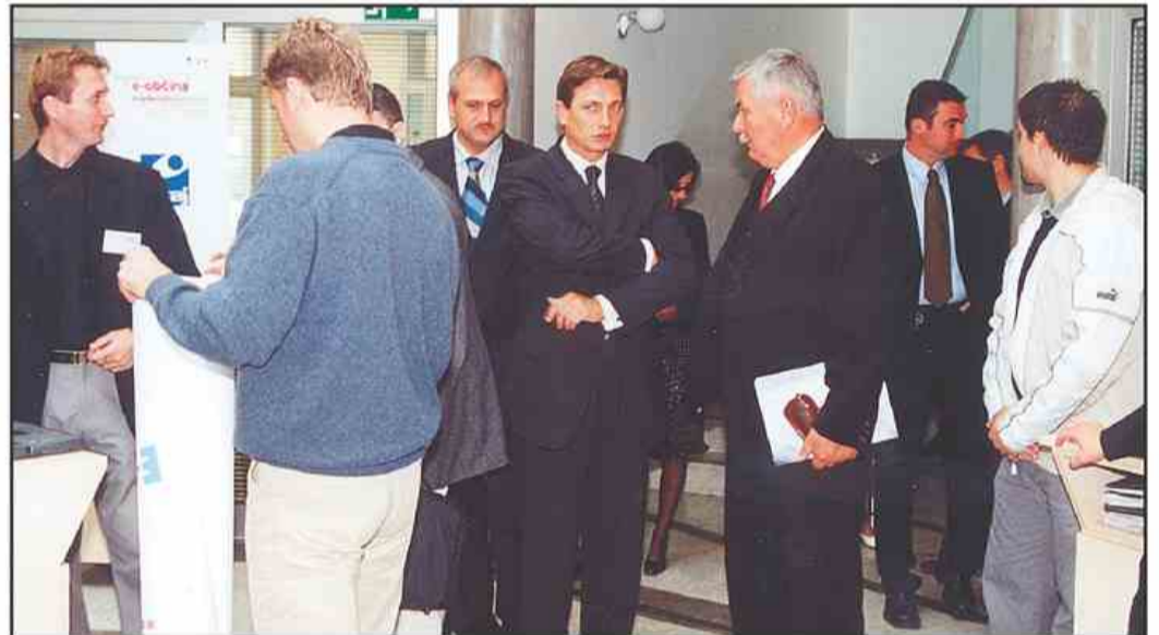
Konferenco je odprl predsednik državnega zbora Borut Pahor.