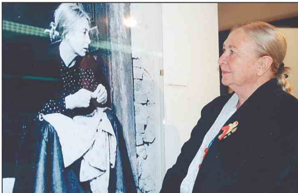
Štefka Drolc med ogledom razstave, ki so jo v galeriji postavili njej v čast. Spomin na številne odlične filmske in gledališke vloge je še zelo živ.

drugih. Tudi Pika Nogavička v sebi združuje več vlog, predvsem takih, ki so všeč otrokom, pa tudi odraslim. Zato nas je zanimalo, koliko Pike v sebi nosi letošnja ambasadorka. »Mislim, da kljub svojim kar mnogim letom, še vedno nosim v sebi otroško srce. To me zelo veseli, mi pomaga živeti in me dviguje. Verjamem v svetle stvari, še vedno se znam navdušiti, biti očarana. V meni je še veliko Pike.«