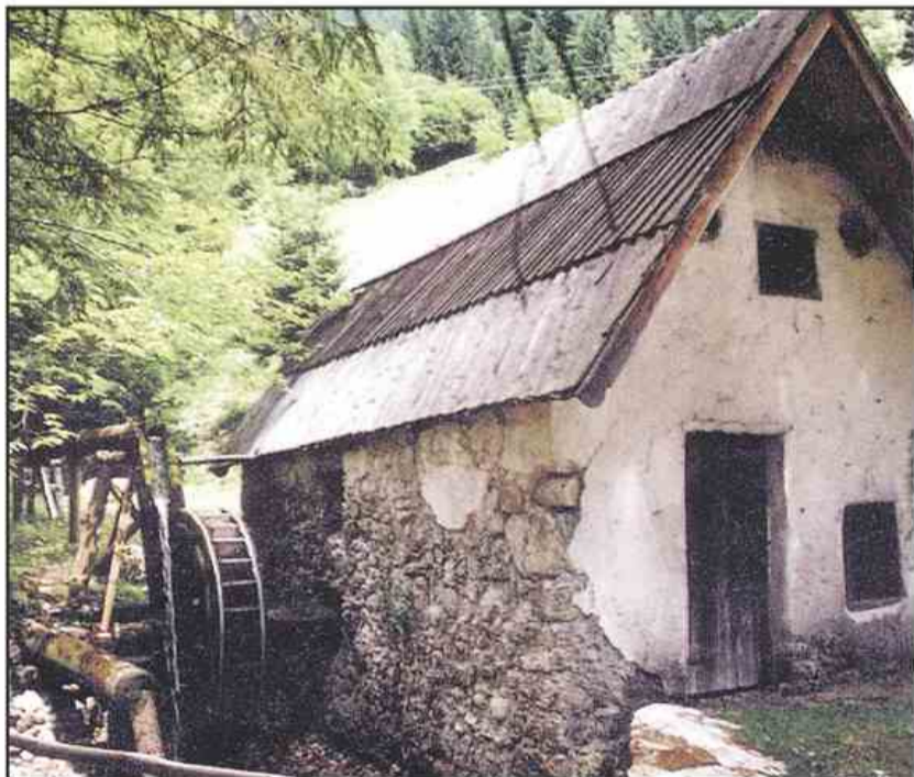
Burjakov mlin je eden od tristotih mlinov, ki so včasih mleli ob današnji Mlinski cesti. Eden redkih, ki je ohranjen, in ki še deluje. Večina jih je izginila. O njih ni več ne duha in ne sluha. Projekt Mlinska cesta, ki povezuje tri občine, Šoštanj in Črna na Koroškem v Sloveniji ter Železno Kaplo v Avstriji, jim znova daje veljavo, marsikje že pozabljeno na novo obuja ter tako ohranja del kulturne in zgodovinske dediščine, obenem pa bogati turistično ponudbo.

na relaciji Šoštanj – Topolšica – Zavodnje – Slime – Črna na Koroškem – Luže in naprej na avstrijsko stran v železno Kaplo. Osrednjo pozornost namenja, kot že ime pove, mlinom, ki jih je bilo na tem območju некоč blizu tristo! Danes jih je ohranjenih zelo malo. V občini Šoštanj Martinčev mlin v