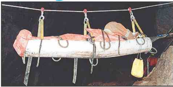
Reševanje je bilo naporno, tudi na višini do 16 metrov, po žičnici.

Tokrat je šlo za vajo. Pred dvema letoma, se spominjajo jamarski reševalci, so imeli resničen