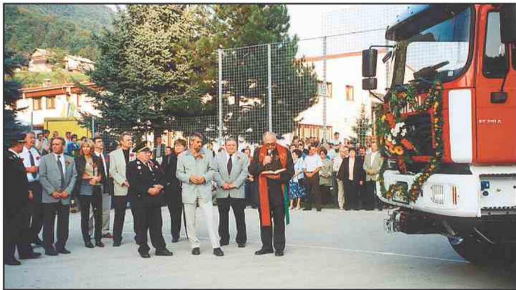
Nova gasilska avtociisterna je sodobna, v kraju, ki je zelo razgiban, pa je bila res potrebna. Splah, ker so prevozi čiste pitne vode tu še vedno vsakdanjik.