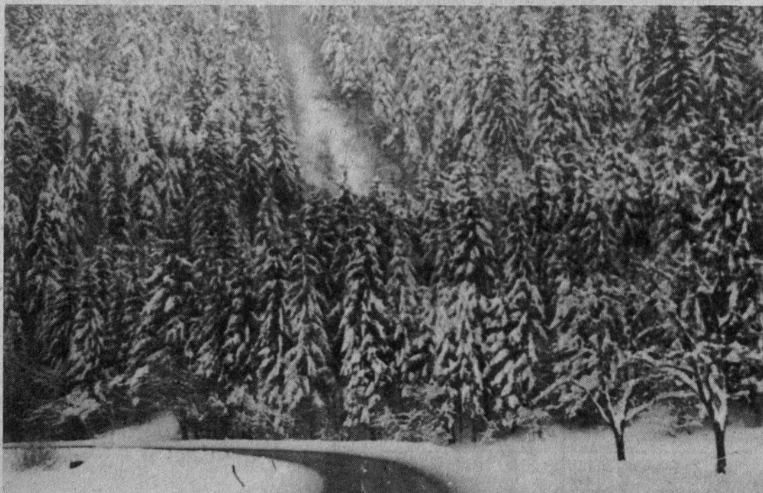
In beli čudež se je vendarle zgodil

Preko vseh teh postopkov smo prišli do volitev, ki bodo, kot smo že zapisali, v četrtek, 9. marca v organizacijah združenega dela in v nedeljo, 12. marca 1978 v Krajevnih skupnostih.