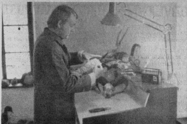
Dela je dovolj