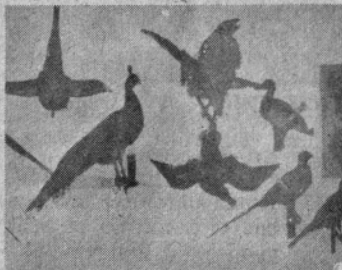
Permate žrtve lovskih strasti

„Imam dovoljenje za delo, nimam pa dovoljenja za nakup nujno potrebne arzenove spojine, brez katere delo ni možno. To mi preprečuje zvezni zakon, republiškega pa niti ni. Upam pa, da se bo z nekoliko razumevanja tudi to uredilo. Pa še nekaj je. Skoraj se bojim, da sam dela ne bom zmogel. Čez nekaj časa bi zato bil pripravljen vzeti koga v uk. Če se bo le našel kdo med mladimi, ki bi se dela lotil s pravim in resničnim veseljem.“