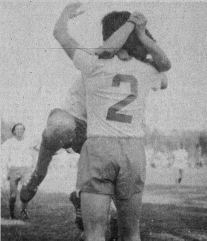
Kljub vsemu se bodo nogometaši in navijači še veselili zadetkov

V zadnji tekmovalni sezoni so člani v A skupini TNZ Celje zasedli drugo mesto, uvrstitev mladincev in pionirjev pa ni znana, ker vodstvo obeh tekmovanj do danes še ni uspelo posredovati podatkov. Člani so zasedli prvo mesto tudi v občinski ligi. Priborili so si 14 točk in dosegli razliko v zadetkih 40:2.