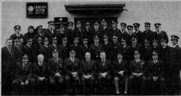
Udeleženci in predavatelji podčastniškega tečaja v Mozirju