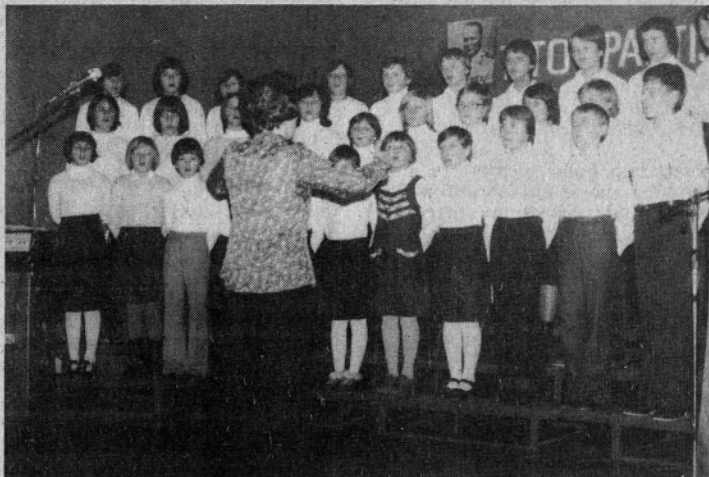
Predvsem najmlajšim je namenjena naša solidarnost

pravljene tri možnosti in za eno od teh se bomo morali odločiti čimprej, predvsem pa bomo morali prebivalci Gornje Šavinjske doline na prihodnjem referendumu zopet potrditi svojo solidarnost. V to dvojni le malokdo.