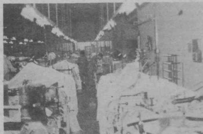
S ponjavami zaščiteni stroji v Velani ne obratujejo

Zdaj pa smo na tem, da »shodimo«, pa vrnemo tudi dolgove za svoje potrošniško