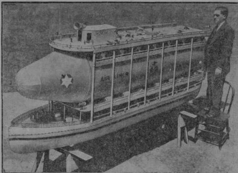
V Ameriki bodo zgradili po modelu, katerega vidimo na sliki, matično ladjo za letala in zrakoplov. Na zgorajnem krovu bo vzletališče za aeroplane, v srednjem bo shranjen »Zeppelin« in v spodnjem bo prostor za potnike.

Boljševiški barbari. Na boljševiške brezbožnike vplivajo cerkve kakor rdeča barva na gotove živali. Čim veličastnejša je cerkev, tem večje je mrzenje boljševikov proti njej. Sredi Moskve je stala krasna cerkev Kristusa Odrešenika, sezidana v spomin rešitve Rusije pred Francozi za časa Napoleona Velikega. Zidala se je nad 40 let ter je bila dozidana leta 1882. Mogočen vtis dela zunanost cerkve, še večji pa njena krasna notranjost. Cerkvena ladja je dolga 68 metrov. Nad njo se dviga velikanska kupola do višine 105 metrov. Na štirih voglih se dvigajo štirje stolpi, ki je v njih viselo 13 zvonov, izmed katerih je bil največji 27.000 kg težak. V notranjosti cerkve so bili zidovi obdani z dragocenim marmorjem, stene so bile krasno poslikane od prvih ruskih umetnikov, tlak je bil marmor-