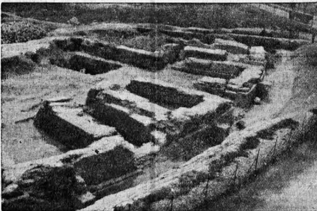
V Obudi pri Budimpešti so izkopali starodaven amfiteater, ki so ga zgradili rimski vojaki v dobi cesarja Avgusta.

Cetrek, 12. avgusta: Belgrad-Zagreb: 20 Arije. 20.30 Orkestralni koncert, 21.15 Narodne pesmi, 21.45 Prenos iz Budve — Dunaj: 19.25 Koroški zvoki, 21. Dunajski simfoniki, 22.20 Zabavní koncert — Budimpešta: 20 Opereta »Vitez Janoš« — Trst-Milan: 17.15 Vokalni koncert, 21 Opereta »Cavalleria rusticana«, nato opereta — Rim-Bari: 21 Izra, 22.15 Zbor — Praga: 19.45 Orkestralni koncert, 20.30 Pester koncert, 22.25 Sodobna turška glasba — Ljnsava: 20 Pester koncert, 22 Vokalni koncert, 22.30 Italijanska glasba — Berlin: 20.10 Plesni večer — Lipsko: 19.10 Vojske pesmi, 21.15 Večerni koncert na samostanskem dvoru — Stuttgart: 20.15 Zabavna in plesna glasba, 21.15 Schubertov godalni kvartet — Monakovo: 19 Operetna glasba, 21 Schumannov klav. kvintet — Strassbourg: 18 Wagnerjeva opereta »Mojstri pevci norimberske« (prenos iz Solnograda).