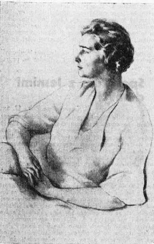
Ljubljana, 12. avgusta.

Dopoldne so z dvornim vlakom iz Dalmacije skozi Ljubljano na Bled potovali Nj. Vel. kraljica Marija z obema kraljevičema Nj. Vis. Tomislavom in Andrejem.