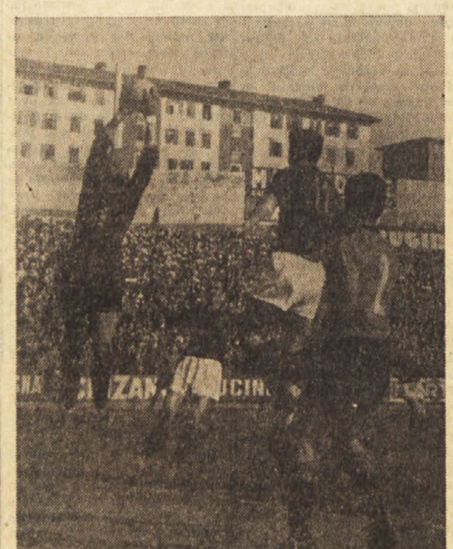
Triestino, ki je večer izgubila v tekmi za italijanski nogometni pokal v Padovi, čaka v nedeljo trda borba na igrišču Alessandria. Igralci prvega moštva se iz Padove ne bodo vrnili domov, pač pa so odpotovali v Salto Terme, kjer bodo preživeli dni pred srečanjem. Kaj čaka Triestino v nedeljo lahko predstavimo. Če v nedeljo ni mogla doseči nič pozitivnega (na sliki je prizor iz tekme z beneskim moštvom), verjetno se ji tudi v prihajajočem kolu ne bo posrežilo rešiti kože