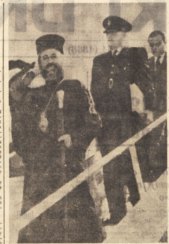
Na letališču Flumicino je prispel ciprski nadškof Makarios, kjer se je zadržal nekaj časa preden je odpotoval v London, kjer bo sodeloval na konferenci Commonwealtha