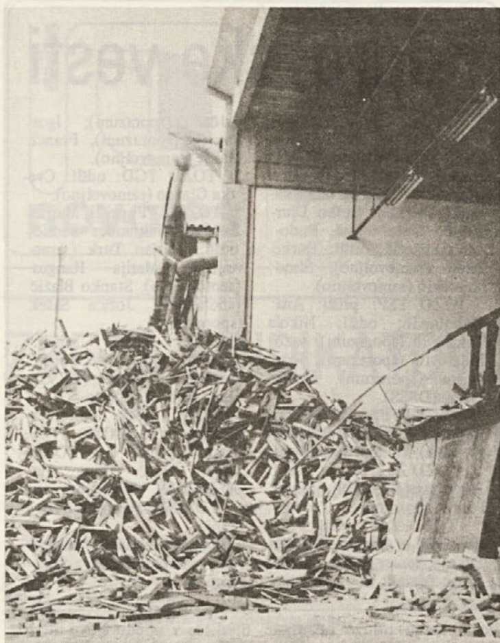
Tak kup lesnih odpadkov (nekdanjih drv) „pospravi“ novi drobilec v slabih treh urah.