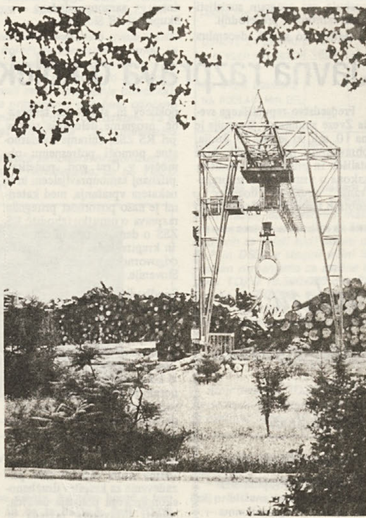
Zaloge hlodovine, ki čaka na razrez, so v poletnih mesecih precej večje kot v zimskih.

Po navedenem in po tem, da se vprašanje ostrine teh konfliktov oziroma prekinitev dela ni pokazalo kot problem, ki ga ni mogoče rešiti z dogovori, se zdi, da bi naše prekinitve zaslužile več razlage v tem smislu, da so prej kazalci demokratičnosti kot pa kakšen patološki pojav. Zgodovina delavskega razreda nas dobro pouči, da so bili edino avto-