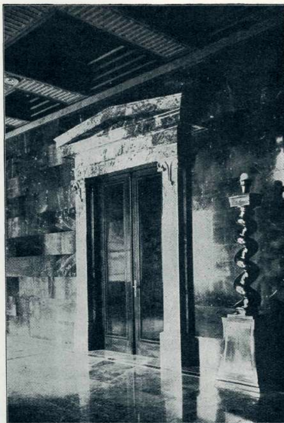
Plečnikova šola (arh. Fr. Tomažič), vhod v veliko dvorano palače Zbornice za TOI v Ljubljani

Že pojav tona samega na sebi in njega menjavo s pavzo (časovno prekinjenje zvenenja) so si glasbeni psihologi in estetik v svoji težnji, opazovati v muziki same »napetosti« in razvozljaje, ki estetski učinkujejo,