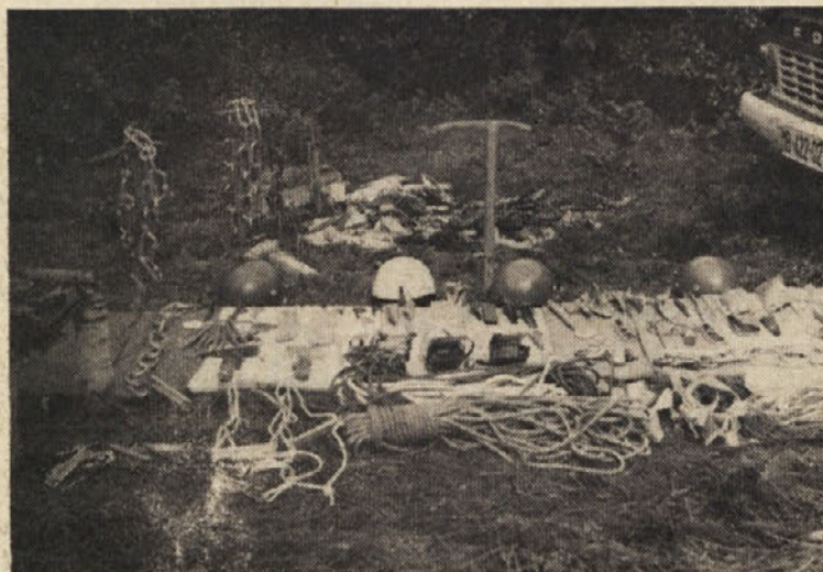
Oprema s katero so plezali člani ekspedicije

V bližini Eihesdala smo si ogledali spomenik norveškega novelista in dramatika ter ljubitelja gora Björnstjena Björnsona. V granitu je izklesan relief plezalca in napis: »Nekaj je zgoraj, moram vedeti kaj in