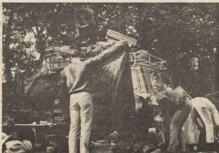
Po krajšem počitku smo morali opremo spet spraviti v in na avto

Prvi dnevi so minevali zelo žalostno, saj je nenehno deževalo. Stena Trolltindena je bila v megli in se nam je zdelo, kot da se skriva za megleno zaveso in da se noče izdati. Po dolini le kilometer navzgor šumi preko stene 600 metrski slap Mordalsfassen. Ker je bilo vreme slabo, smo se odločili, da si ogledamo ta čudovit slap, ki pada v dveh delih preko 655 metrov visokih sten, njegov največji prosti pad pa šteje 297