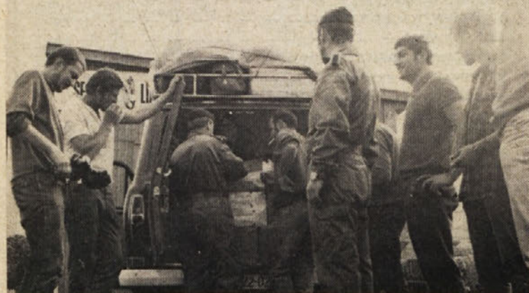
Totalni carinski pregled na švedski meji