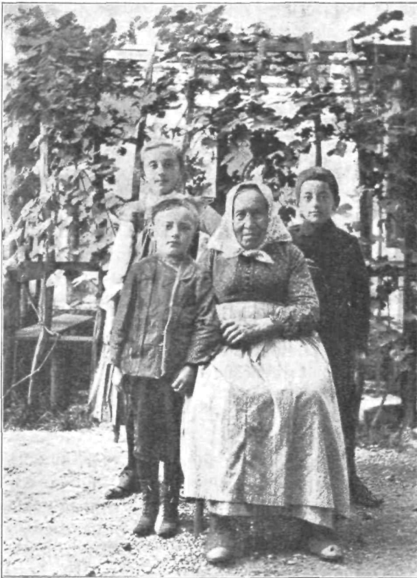
Na obisku pri stari materi.