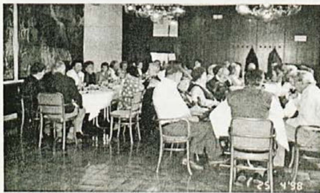
Pristrčen »klepet« sošolk in sošolcev

Nasvidenje naslednje leto!!! Zapisal Dvorčakov Marjan