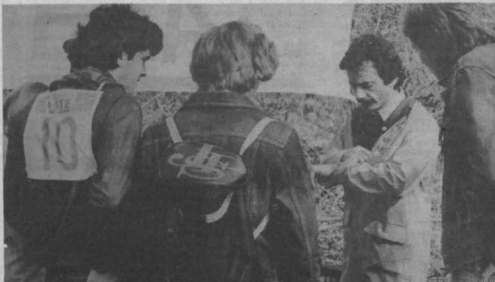
Na finalnem občinskem tekmovanju so se pomerili najboljši in pokazali odlične rezultate