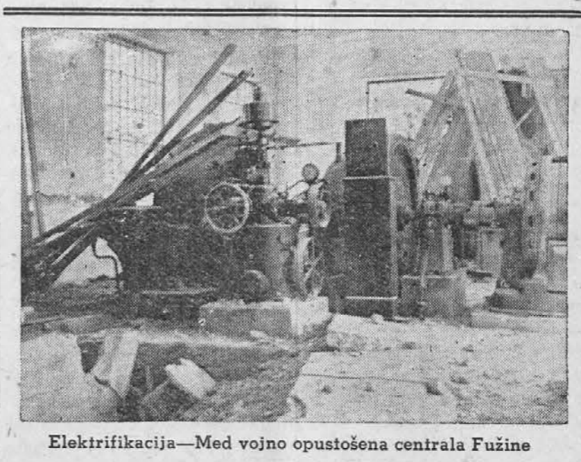
Elektrifikacija—Med vojno opustošena centrala Fužine

Ne gre niti za to, da so pehali razni zaščitniki "zapadne kulture" od Focha do Bullita, od Chamberlaina do Hoovera, Hitlerja na vse, kar je sledilo. Gre za to, da je preveč skupnega med licemerskimi pridigami imperialistov 1947. leta in knjigo "Mein Kampf," med imperializmom 1947. leta in fašizmom. Pokrovitelji Franca branijo svobodo, krvniki Grčije se zgrajajo nad nasiljem, ljubitelji vojnih baz v petih delih sveta obsojajo osvajaalne tendence, gospodarji sužnjevi žigosajo nacizem. Ti ljudje lahko praznujejo zmago nad Nemčijo. Ne bom zdaj omenjal, kako so se vojskovali in kako so zmagali. Toda prav zares se jim ne spodobi praznovati zmago nad fašizmom: je vrv, o kateri v hiši Linchevih privržencev ne kaže govoriti.