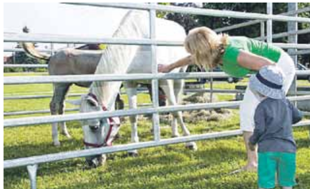
Na BIO DNEVU se je prvič predstavil tudi Oddelk za zootehniko Biotehnične fakultete, ki domuje v Grobljah. Predstavili so avtohtone slovenske pasme živali in otrokom pripravili veliko veselja, saj so od blizu videli konja z žrebičkom, zajčke in kokoši.