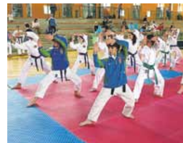
Foto: Utrinek s šolskega državnega S.K.I.F. prvenstva v karateju