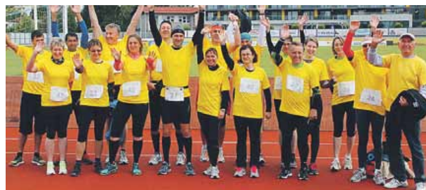
Radomljanke in Radomljani že mahajo 670-letnici