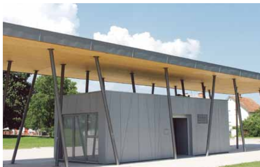
Paviljon v Češminovem parku v Domžalah