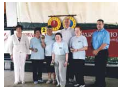
Državne podprvakinje, balinarke Medobčinskega društva invalidov Domžale z gosti.