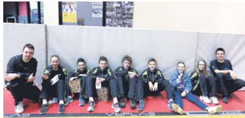
Dobra volja med udeleženci NTS-ja Mengeš na Masters namiznoteniškem turnirju v Velenju

V Velenju je v začetku junija potekal letošnji masters (zaključni) turnir v namiznem tenisu, ki se ga v okviru posamezne kategorije lahko udeleži samo 16 najboljših igralcev in igralcev iz Slovenije.