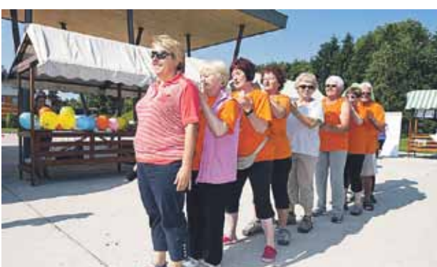
Predstavitvi 1000 gibov Šole zdravja je na koncu sledila tudi medsebojna sproščujoča masaža.