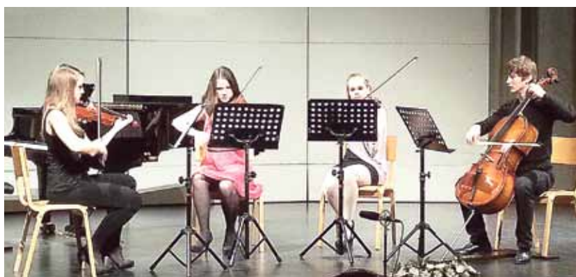
Mladi glasbeniki so takole sklenili zaključni koncert.

Kot je v navadi, je konec šolskega leta po navadi rezerviran za številne zaključne koncerte, med katerimi pa tokrat velja izpostaviti tistega, ki je bil v torek, 4. junija, v Tomčevi dvorani Kulturnega doma Franca Bernika.