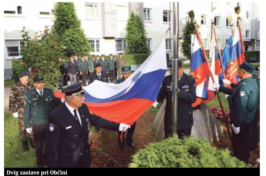
Dvig zastave pri Občini