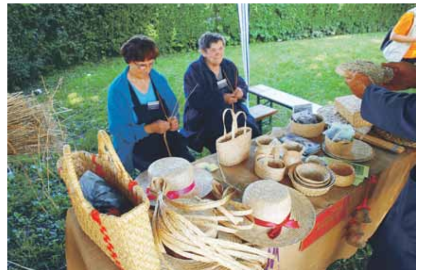
V KUD Fran Maselj Podlimbarski iz Krašnje zelo uspešno nadaljujejo tradicijo pletenja kit ter tako živo ohranjajo našo dediščino.