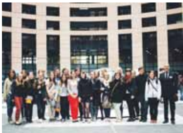
Skupinska fotografija pred evropskim parlamentom