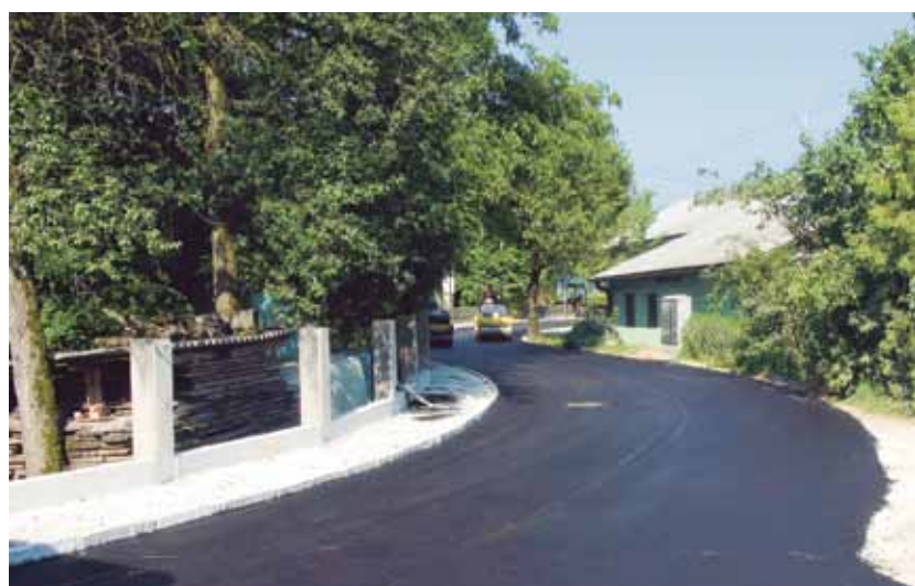
Rekonstrukcija ceste v Študi

Občina Domžale bo v okviru sredstev, pridobljenih iz Evropskega sklada za regionalni razvoj, operativnega programa krepitve regionalnih razvojnih potencialov 2007–2013, za obdobje 2012–2014, razvojne prioritete (razvoj regij, prednostne usmeritve: regionalni razvojni programi) pričela uresničevati s posegom 19 – to je ureditev poti okoli Šumberka. Predvidena je ureditev sprehajalne poti, počivališč, v kombinaciji z otroškimi igriščem, dostop do obeh rek ter krajinska ureditev obvodnega sveta. Trenutno poteka javni razpis. Gradnja bo potekala v poletnem času.