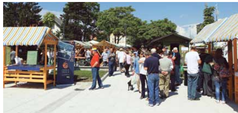
Sobotno dopoldne na novi večnamenski ploščadi pri tržnem prostoru Domžale so popestrili gostje z Izole

DOMŽALE Na stojnicah so obiskovalci lahko okušali dobrote slovenskega Primorja – sredozemske klapavice, priznana primorska vina, olive in oljčno olje, sol iz sečoveljskih solin in ostale dobrote. Prav tako je s sredozemsko ponudbo, tako kot vsak petek in soboto, goste razvajala gostilna Ribič iz Izole. S turistično ponudbo se je predstavilo tudi Turistično združenje Izola, ki je obiskovalcem ponujalo zelo ugodne počitniške kapacitete na slovenski obali.