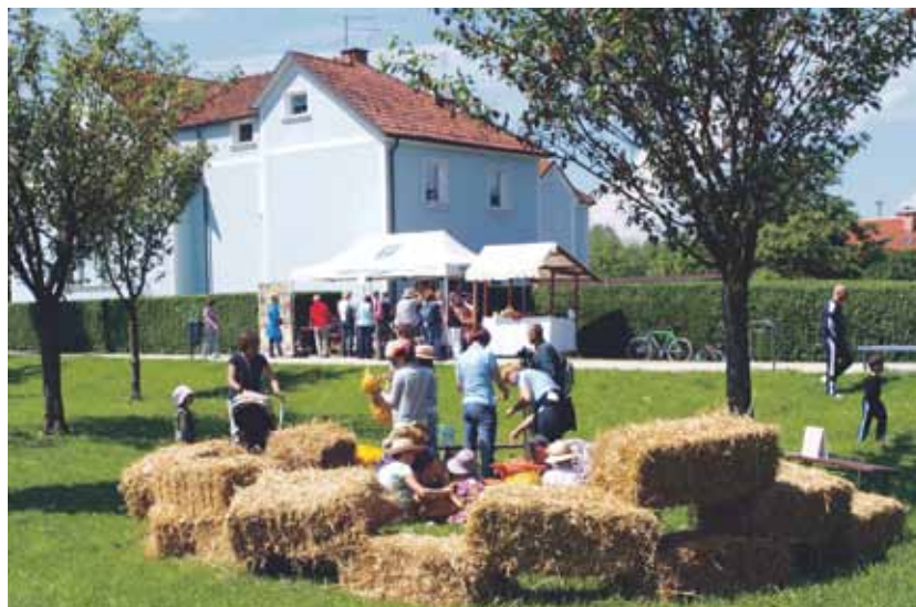
V "vrtcu" so izdelovali pujske iz slame. Na stojnici Slamnikarskega muzeja pa ste se lahko naučili plesti kite in šivati slamnike ali pa ste si slamnik preprosto izbrali in kupili.