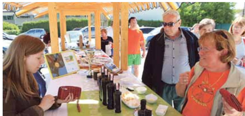
Mediteranska ponudba na stojnicah