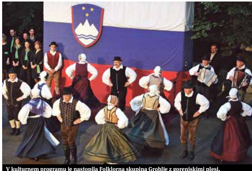
V kulturnem programu je nastopila Folklorna skupina Groblje z gorenjskimi plesi.

Kulturni program, ki ga je pripravilo Kulturno društvo Jožef Virk Dob, je predstavljal odlično uro domoljublja, kjer so prav vsi nastopajoči izražali ljubezen do naše Slovenije: Mešani pevski zbor Hippemus