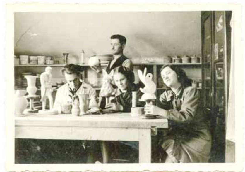
Delavci v tovarni Dekor; fotografija iz arhiva Gregorja Kocjana.