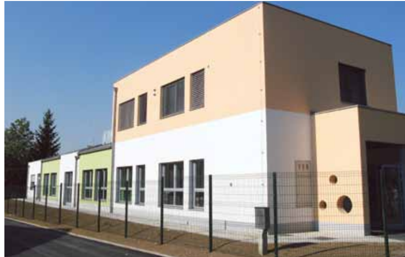
Vrtec Palček na Viru

OBČINA DOMŽALE, URAD ŽUPANA FOTO: VIDO REPANŠEK