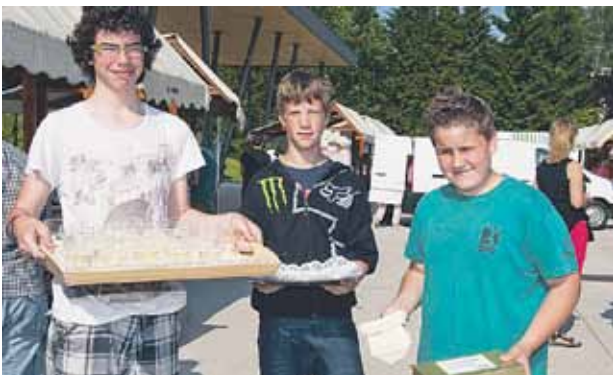
Učenci OŠ Domžale so za obiskovalce pripravili tudi srečelov, dobitki pa so bili izdelki iz njihove lastne izdelave, od piškotov, bezgovega sirupa in ročnih izdelkov.