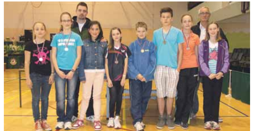
Letošnji finale državnega prvenstva v namiznem tenisu za osnovnošolce je postregel z odličnimi rezultati. Jih bodo udeleženci naslednje leto ponovili ali še izboljšali?