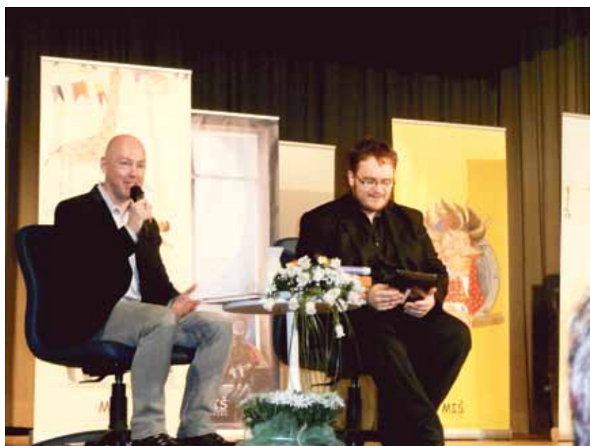
Zanimivo je bilo poslušati znanega irskega pisatelja Johna Boyna.

ZPM Domžale: Knjiga naj bo vaša zvesta prijateljica na poti skozi življenje.