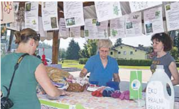
Na stojnici OŠ Dragomelj, ene od eko šol, smo med drugim dobili recept za pripravo domačega pralnega praška.

Vsekakor lahko ocenimo, da je bil namen prireditve v celoti dosežen. V okviru projekta BIO UŽITEK, ki ga sofinancira tudi EU, smo tako javnosti predstavili ekološko kmetijstvo in osnovna načela ekološko pridelane hrane. S tem se potrošnike tudi spodbuja k večji uporabi v Sloveniji pridelane ekološke hrane, spoštovanju sezonsko pridelanih živil iz neposredne okolice ter spoznavanju pristne, sveže, okusne hrane, ki je pravi užitek. Hkrati smo sledili tudi cilju, da se v to vključi čim več mladih, ki jih tako seznanjamo z osnovnimi načeli naravi in okolju prijaznega kmetovanja, spoštovanja do dela slovenskega kmeta in načina življenja, katerega vodilo je zdrav življenjski slog. Na koncu smo se razšli v upanju, da se spet vidimo na jesenskem, petem BIO DNEVU konec septembra. □