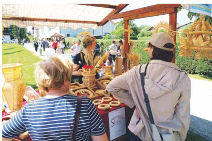
Obiskovalci so z zanimanjem občudovali "umetnije" iz slame.