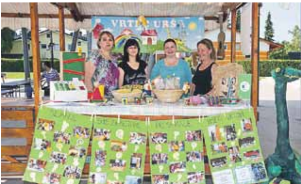
Sodeloval je tudi vrtec Urša, ki je s fotografijami in plakati predstavil bogato aktivnost pri vzgoji in učenju pridelave hrane.