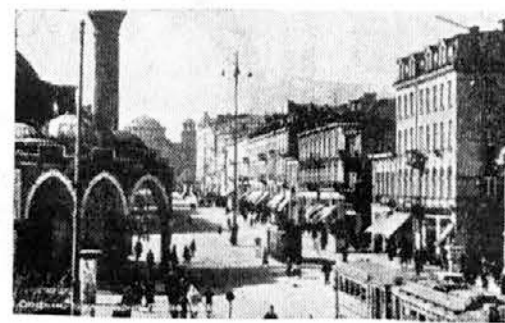
Slika iz Sofije.