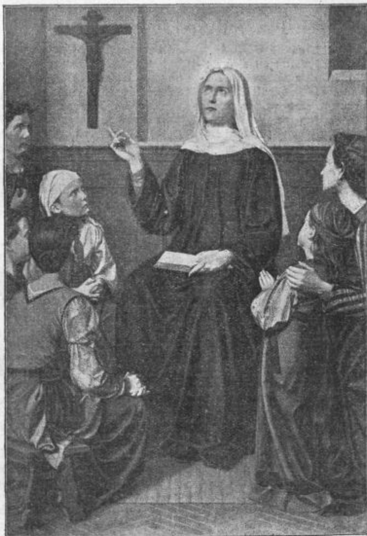
Sv. Angela Merici.

jenost in hinavstvo. In da smo odkriti na vse strani: celó po naših podeželskih odrih, ki imajo za namen srčno oblažitev in izobrazbo preprostega ljudstva, ni vse v redu. Kaj se je tekom časa že vse vteplo med igralce in gledalce — tisti vé, ki opazuje in izkuša. Ko pa pride na deželo še umazani kino s svojo kulturo, potem se