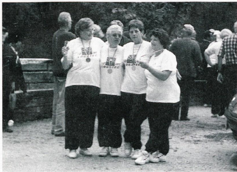
Zmagovalna ženska balinarska ekipa

prostorih, je njihova vnema vredna vse pohvale.