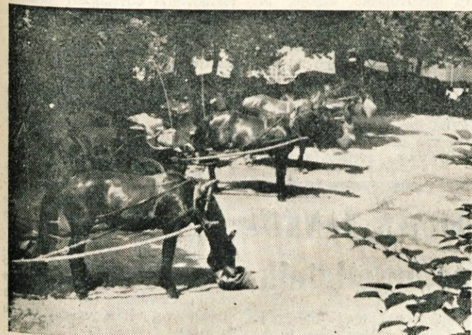
Za turiste so kočijaži na Bledu dokajšnja zanimivost. Kako tudi ne, saj jih velika mesta skoraj ne premorejo več.

Razen Belgijcev se tudi Svicarji močno zanimajo za turistične privlačnosti Gorenjske. V letošnji sezoni sta obiskali Gorenjsko kar dve filmski skupini iz Švice, in sicer ekipa Radio-televizije in ekipa lovške zveze.