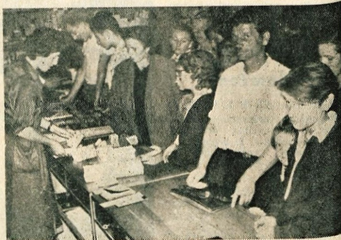
Knjigarna »Simon Jenko« v Kranju je bila zadnje dni nabito polna. Začela se je šola, vendar so številni zamenjani čakali, da bi lahko svojim otrokom kupili potrebne šolske knjige.

TRGOVSKA PODJETJA S POLJEDELSKIMI PRIDELKI KMETIJSKE ZADRUGE KMETOVALCI Nudimo Vam po ugodni ceni gajbice - jabučare velikost JUG standarda.