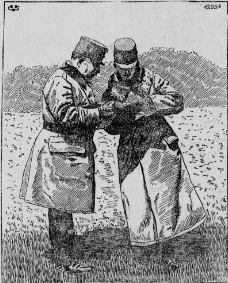
Nj. Velič. cesar Karel in general pl. Arz na fronti v Galiciji.

Dvadnevni odmor, 21. in 22. maja. Po neprestanih sedemdnevnih težkih pehotnih bojih je postalo 21. in 22. maja nekoliko