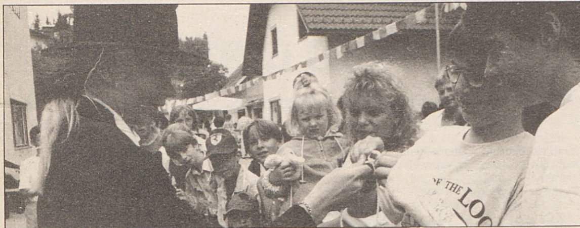
Na Mladinskem dnevju sta vladali bogata ponudba . . .