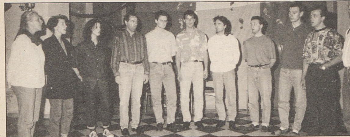
Tudi graški študentje/graške študentke so zapeli.