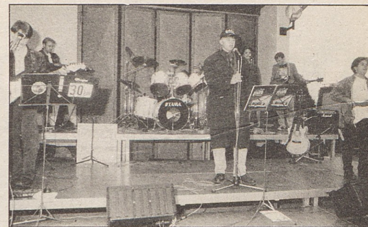
Pop-skupina „The Caps“ iz Šmihela