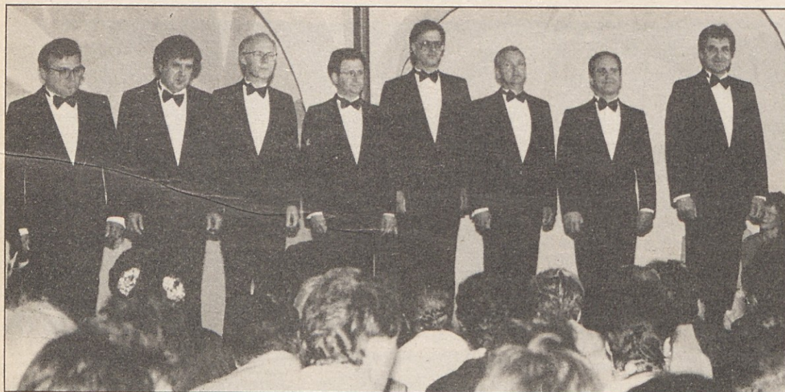
Tržaški oktet je navdušil tako na koncertu kakor pri sv. maši.