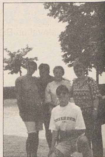
Klubaši v bližini Opčin