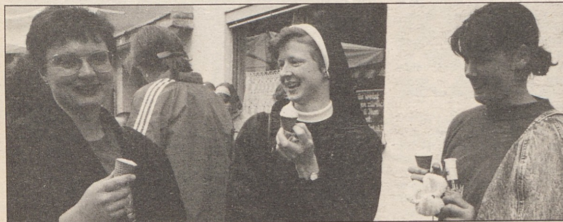
. . . in sproščenost.