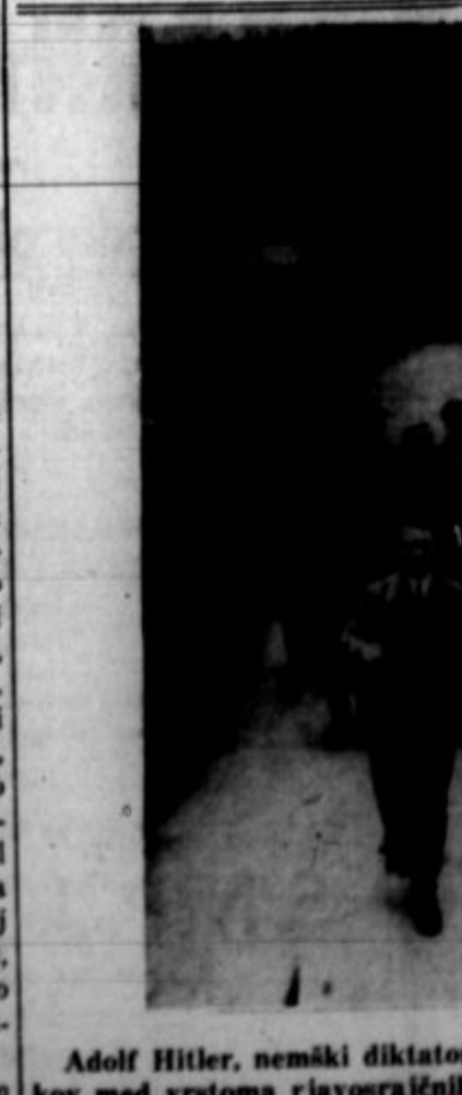
Adolf Hitler, nemški diktator, koraka na čelu nacijskih veljakov med vrstoma rjavosrajčnikov.

Fašizem je pred padcem. Vprašanje konca fašizma pa je za nas in za vso Evropo, da, za ves svet, civilizacijo in kulturo važno vprašanje. Z njegovim padcem bi izgubila vsa slična gibanja svojo moč, utemeljenost in udarnost. Z lahkoto bo še njim pokazati njihovo pot in konec. Vendar pa, kar se dogaja danes v Italiji, pusti lahko