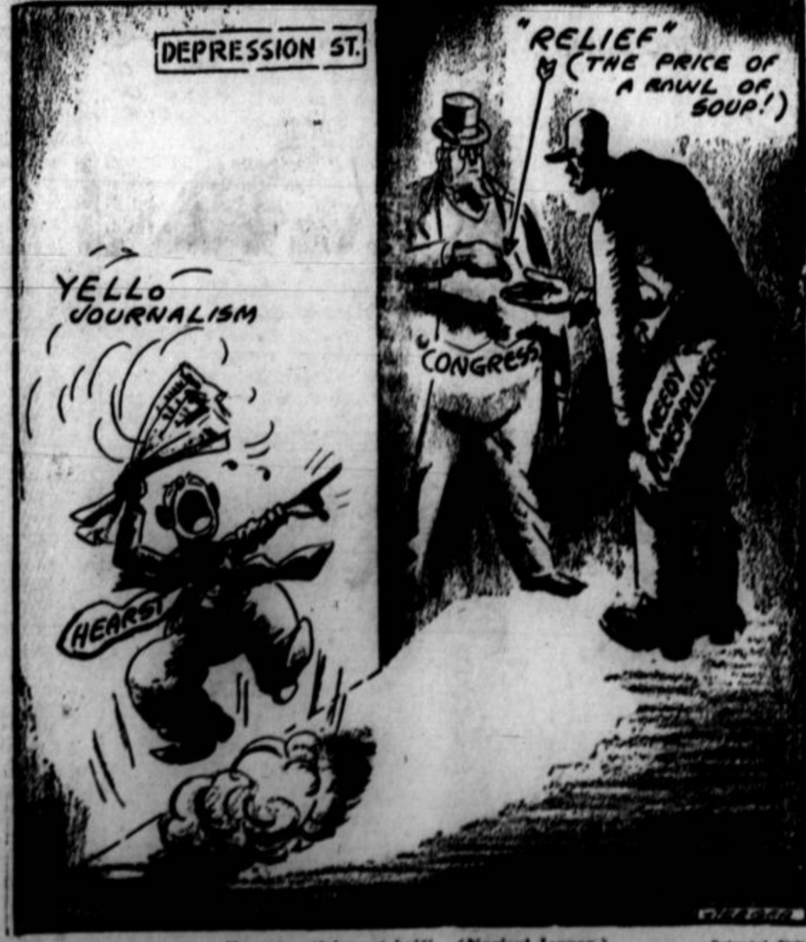
Hearstov tisk spet kriči. (Narisan Jerger.)

Cincinnati, O. — Mednarodna unija pivovarniških delavcev je naznanila, da je pivovarniška industrija absorbirala 650.000 delavcev po odpravi prohibicije, izplačala v tem času $200,000,000 delavcem in farmerjem za žito nadaljnjih $150,000,000. Vsota davkov, ki so jo prejela državne, federalna, mestne in krajevne vlade, znaša nad $800,000,000.