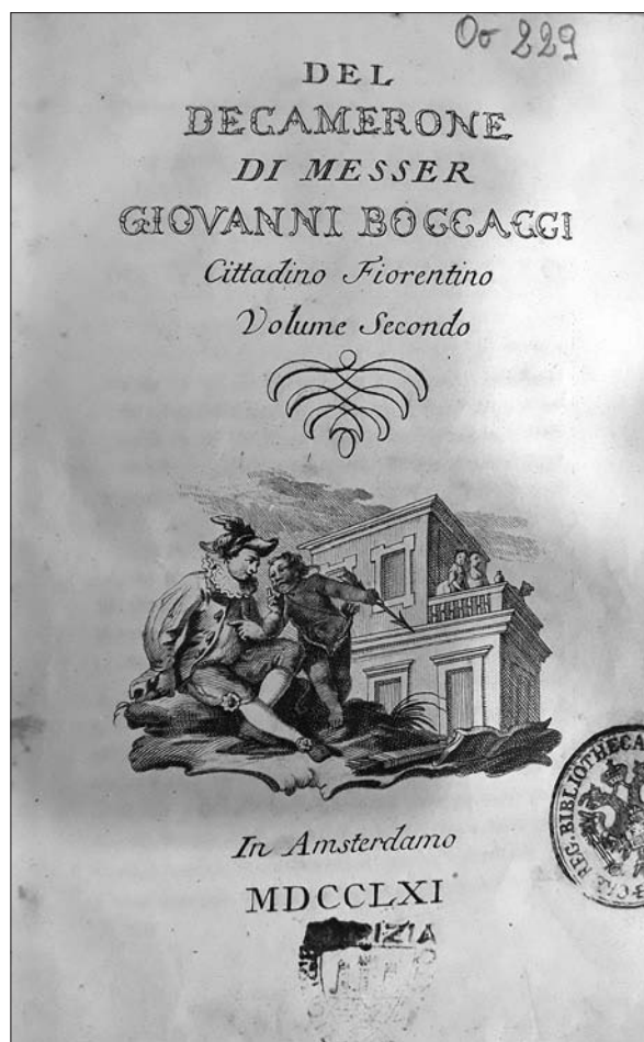
Naslovnica knjige »Del Decamerone di Messer Giovanni Boccacci«, Amsterdam [Venezia, A. Locatelli] 1761 v enakem izvodu, kot ga je imel Žiga Zois (Gorizia, Biblioteca Isontina, coll. O-00229).

Če se omejimo na dela italijanskih avtorjev, ugotovimo, da so v istem katalogu navedeni ponatisi iz 18. stoletja Dantejevih, 16 Petrarcovih, 17 Boccaccievih in Tassovih mojstrov. 18 Preseneča nas, da med nji-