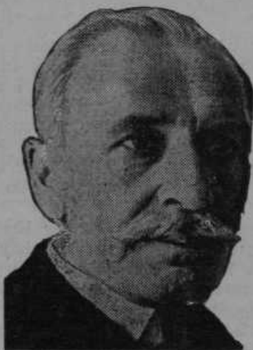
Dr. Ignacij Mościcki, 10 let predsednik Poljske.