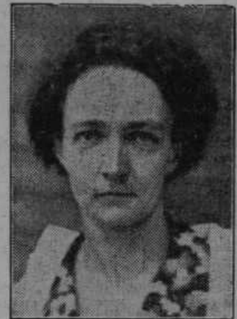
Čeravno nimajo v Franciji ženske volilne pravice, je bila poklicana v sedajno francosko vlado kot državna podtajnica za znanost gospa Joliot-Curie.