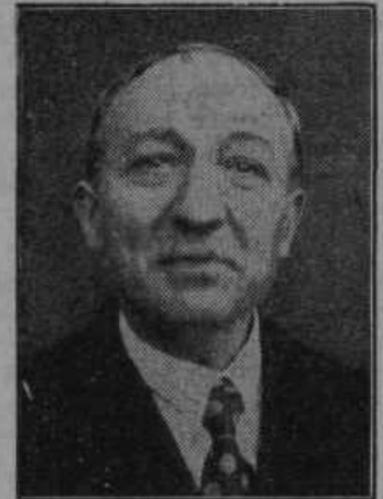
Novi francoski zunanji minister Yon Delbons, radikal.

Če se igra otrok z vžigalicami. Med tem, ko sta bila zakonca Matija in Neža Mohorko na Ptujski gori zaposlena na njivi, se je igral šestletni sinko na škednju z vžigalicami. Naenkrat je vzplamnela tamkaj shranjena slama. Predno je