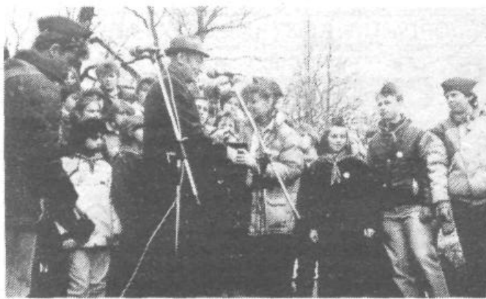
Kurirčkovo pošto so pionirji iz vseh petih ljubljanskih občin pospremili veselo in razigrano ob prijetnih zvokih ansambla 12. nasprotje. Ob tej priložnosti jim je društvo prijateljev mladine občine Lj. Šiška pripravilo bogat in pester kulturni program. Nastopili so člani gledališke in pisne skupine Svoboda iz Medvode, Lovski pevski zbor iz Medvode, mladinski pevski zbor iz OŠ Leopold Maček, folkorna skupina iz OŠ z Dobrove pri Ljubljani, godba mlilice, plesna skupina Gu-gu in še kdo. Da bi se jim ta dogodek čim bolj vtisnil v spomin, so se prvi kurirji vkrcali v helikopter. Na veselje mnogih ljubljanskih pionirjev je ta pristal sredi Ljubljane, v Tivoliju.