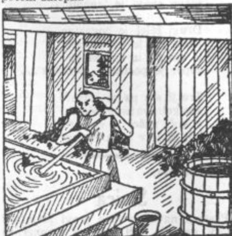
Kitajska papirnica iz devetega stoletja

To umetnost so pozneje spoznali tudi v Grčiji in Italiji, dosti kasneje pa je prodrla tudi do drugih narodov na severu in vzhodu. Pri teh narodih so znali navadno le duhovniki brati in pisati. Kože, ki so jih potrebovali za pisanje, so si sami pripravili in ustrojili, tako da so jih namočili v apneno vodo, odrgnili diaško in kože zgladili z lahkim plovcem. Preluknjane in natrgane dele kože pa so potem zalepili.