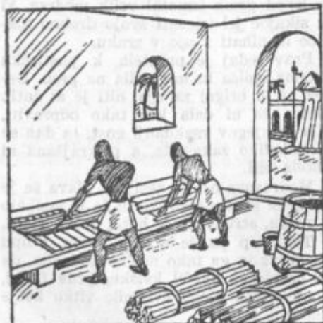
Izdelovanje papirja v starem Egiptu

Perzijsko sveto pismo je bilo bajep napisano na 1200 kravjih kožah, ki so jih dobili od žrtvovanih živali. 2000 let pred Kristusovim rojstvom je živel v mestu Pergamu kralj, ki je odkril, kako se kože strojijo, da so primernejše za pisanje in od takrat govorimo o »pergamentih«.