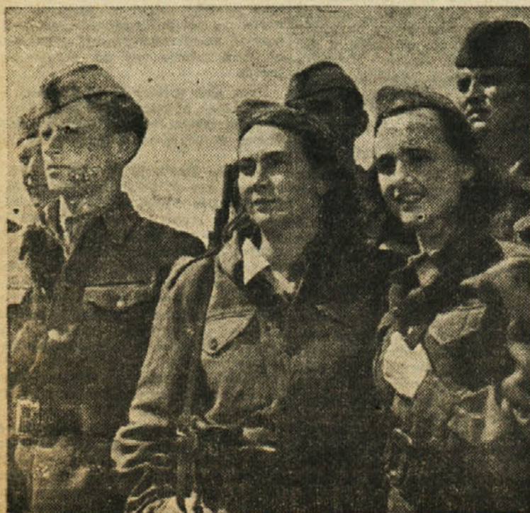
Scena iz filma »Na svoji zemlji«

Tovarna dokumentnega in kartonskega papirja Radeče