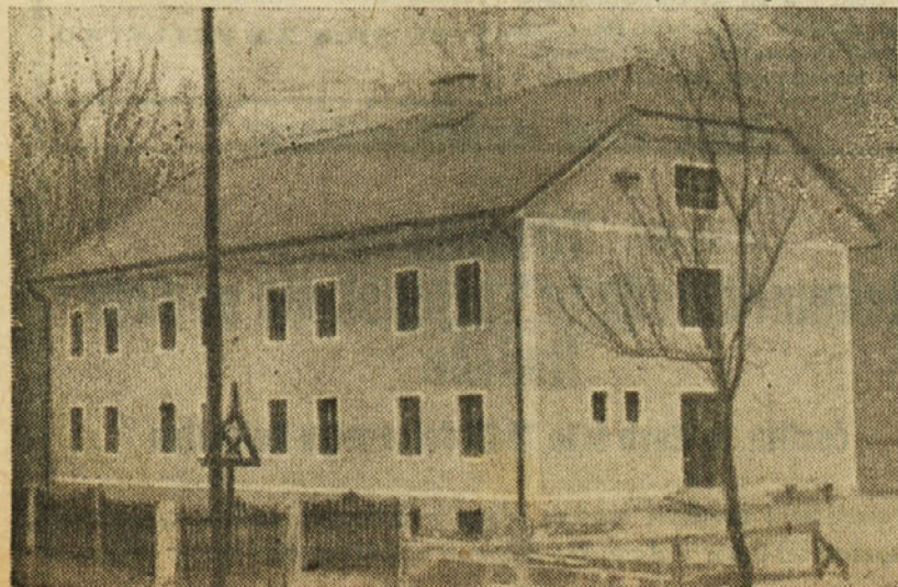
Samski dom kemične tovarne