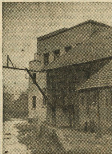
Del stare tovarne v ozadju nova

Člani delovnega kolektiva pa so bili tudi sicer vedno pripravljeni pomagati pri vseh akcijah in so bili prvi, ki so