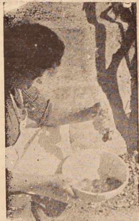
V zaklani kuri čez 250 jajc! (B. D. iz M. Sobote)

Povedal jim je, da je padel v sneg in ni mogel iz njegovega obzora. Konj je stal ves čas ob njem in ga grel s svojim dihanjem. Če je starec hotel zaspati ga je budil s hrzanjem. Starec in njegov doživljenjaj je predmet razgovora v vsem okolišu.