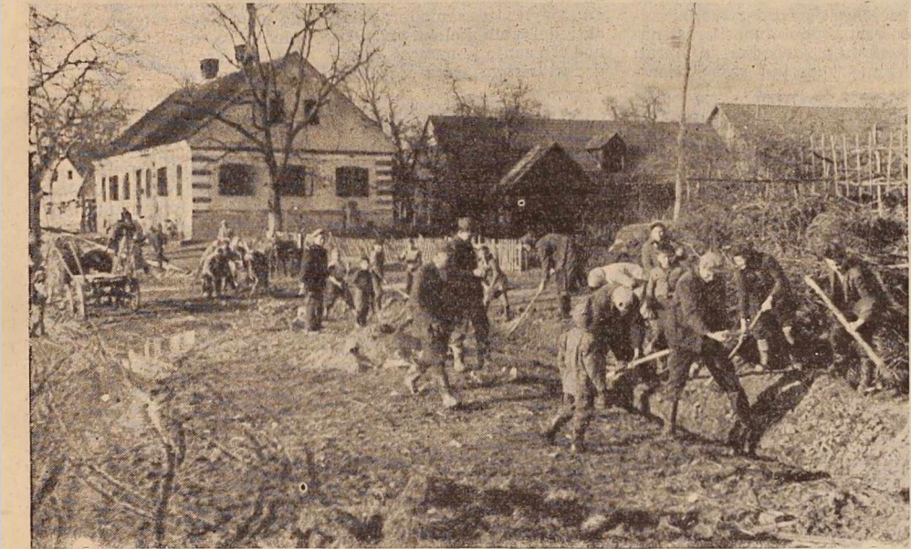
Prostovoljna dela vaščanov Boračeve pri gradnji vodovoda, ki ga bodo speljali od slatinskega obrata v Boračevi v vas, v dolžini 500 m.

Kot v poročilu, tako je bilo tudi v razpravi poudarjeno, da je potrebna večja aktivnost, predvsem mlajših komunistov v mladinski organizaciji. Na šolah naj bi o oblikah in metodah političnega dela večkrat razpravljali tudi aktivni komunistov prosvetnih delavcev, prav tako naj bi posvečali večjo pozornost mladim ljudem v podjetjih, kjer pogostokrat mladino samo kritizirajo, ne obravnavajo pa je tako kot bi bilo to za mlade ljudi, ki so zrastle v novih pogojih, potrebno. —jm