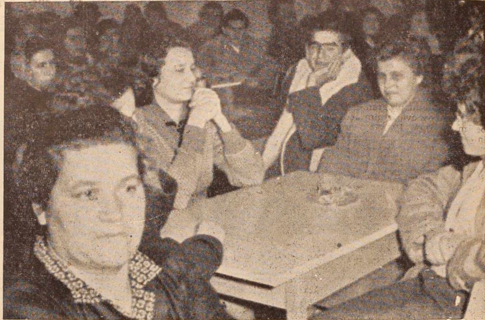
Tovarna perila in težke konfekcije v Soboti zaposluje pretežno žene

Posvetovanje o kulturno-prosvetni problematiki radgonske občine