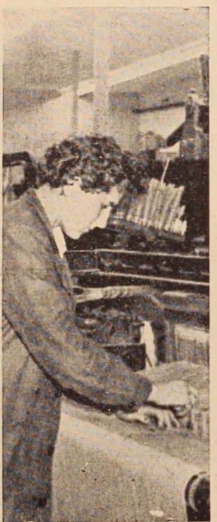
Pri pletilnem stroju

V Ljutomeru beležijo uspehe predvsem glede varstveno-vzgojnih ustanov in pomožne šole za duševno deketne otroke. Zdj se je predsedstvo konference za družbeno aktivnost žena le lotilo problema mlečnih kuhinj po šolam. Dalje žene v ljutomerski občini v precejšnji meri obiskujejo šole za starše v Ljutomeru, Križevcih, Stročji vasi in Razkrižju, vendar so premalo storile doslej za izobraževanje žena gospodarske organizacije. Sicer pa je vinograd-