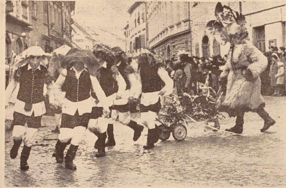
Kot smo že poročali, je bilo v nedeljo v Ptujju veliko kurentovanje, katerega si ogledalo več tisoč ljudi.