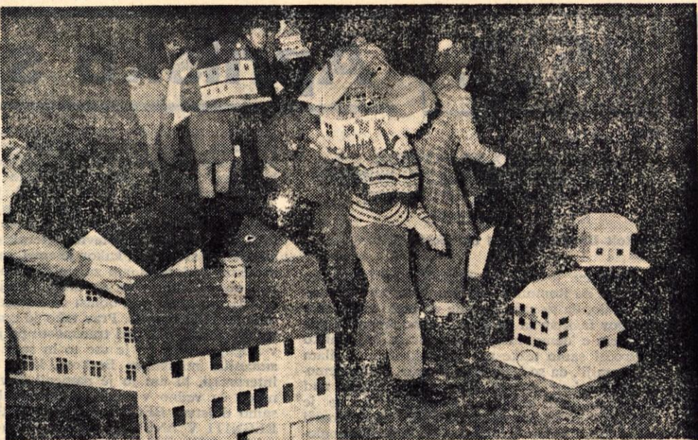
Na narasli Tržiški Bistrici so se v soju velikega kresa pozibavali »gregorčki«.

Danes ne spuščajo več pletenih košev z odpadki usnja, temveč izdelajo otroci različne hišice iz lepenke ali lesa, v njih prižgejo sveče ter hišice privezane na vrvice spustijo po reki. Letošnje leto so se tega lotili v vseh treh