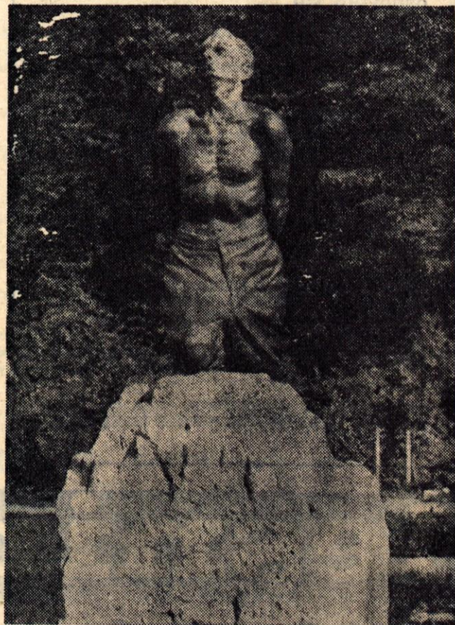
Spomenik mengeškim talcem na mestu, kjer so Nemci 8. januarja 1944 ustrelili trideset Mengšanov in okoličanov. Spomenik je izdelal pokojni kipar Jaka Savinšek.

Organizacija rdečega križa pričakuje, da bodo naši občani tudi tokrat pokazali polno razumevanje pri tej humani solidarnostni akciji. J. C.