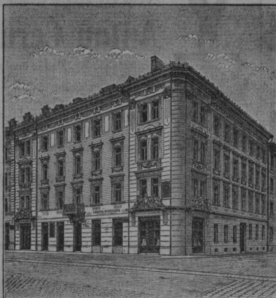
Stanje upravnega premoženja koncem oktobr 1907: K 12.746.874-08.

Čeniki za tiskovine in pisarniške potrebščine so brezplačno na razpolago. — Trgovci in preprodajalci imajo izjemne cene. — Priznana dobro blago. Solidna in točna postrežba. 5 52-31