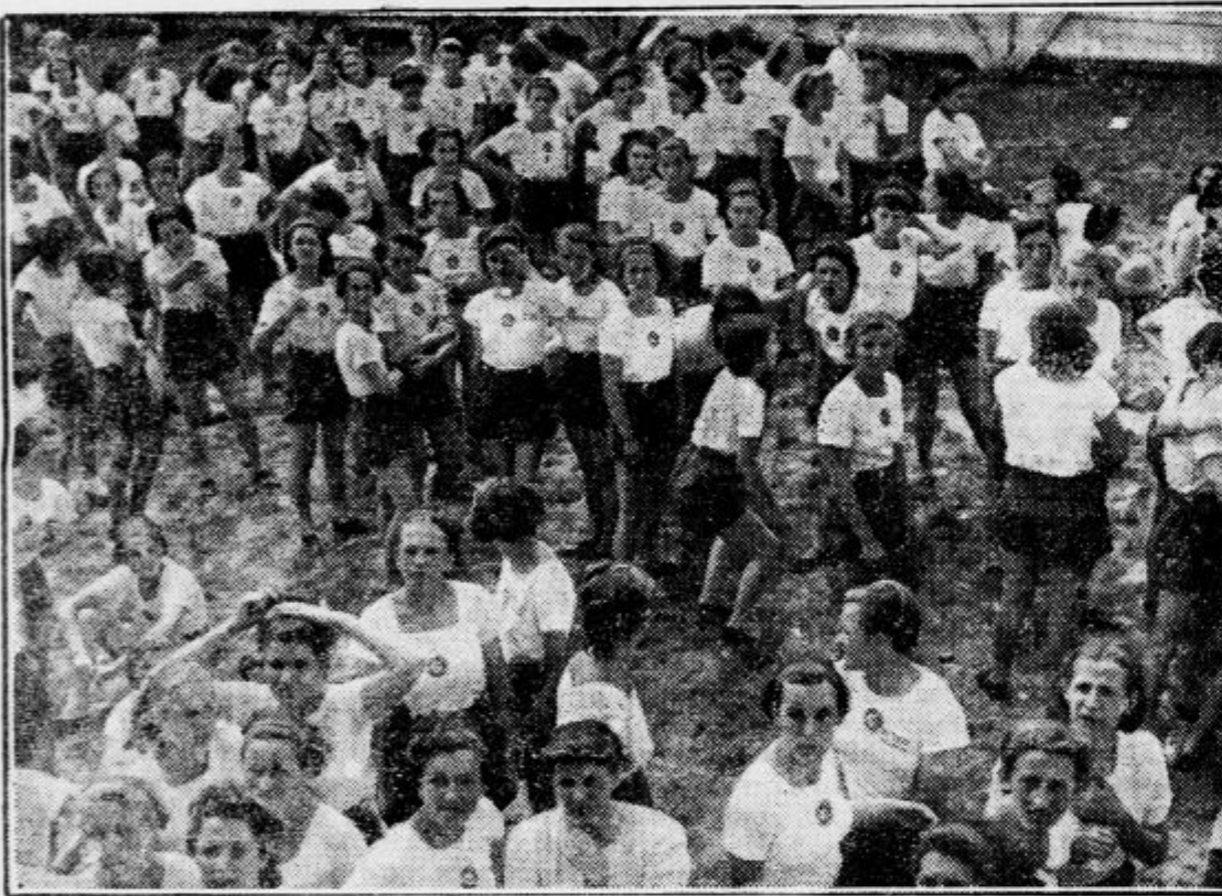
Naše naraščajnice čakajo pri garderobah na svoj zadnji nastop