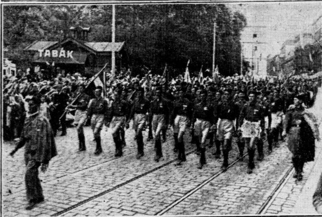
Jugoslovanski naraščaj v sprevedu