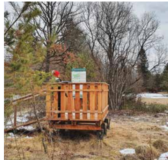
Razgledni podest skupaj z informacijsko tablo.

Več o območjih projekta Mala barja–Marja in aktivnostih na terenu si lahko