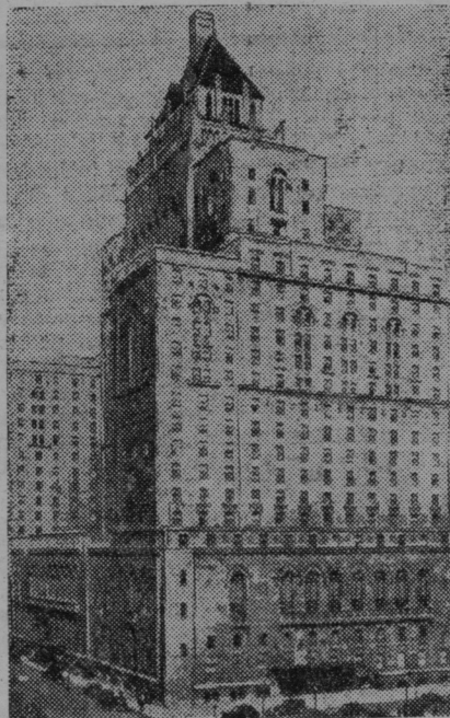
Največji hotel vseh udobnosti so otvorili v Toronto v Kanadi v Sev. Ameriki