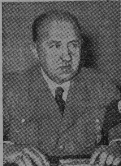
Dr. Funk, nemški gospodarski minister, je imenovan od Hitlerja za predsednika nemške državne banke

sveta 40 novih župljanov, in to 20 dečkov in 20 deklic. V večnost se je preselilo 32 oseb, 20 žensk in 12 moških. V zakon je stopilo šest parov. — Pri državnozbornih volitvah smo Polensani temeljito pomeli z mačkovci. Izmed 329 volilcev je volilo 251, in to 248 JRZ in samo trije so zamjavkali.