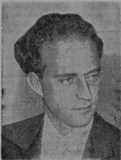
Belgijski kralj Leopold III. bo imel ob priliki otvoritve njujorske svetovne razstave iz Bruslja 26. februarja nagovor po radiu, katerega bodo prenašale vse ameriške radiopostaje