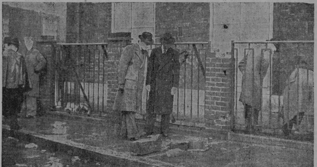
Angleški detektivi preiskujejo v Londonu kraj, kjer je eksplodirala na tajinstven način bomba.