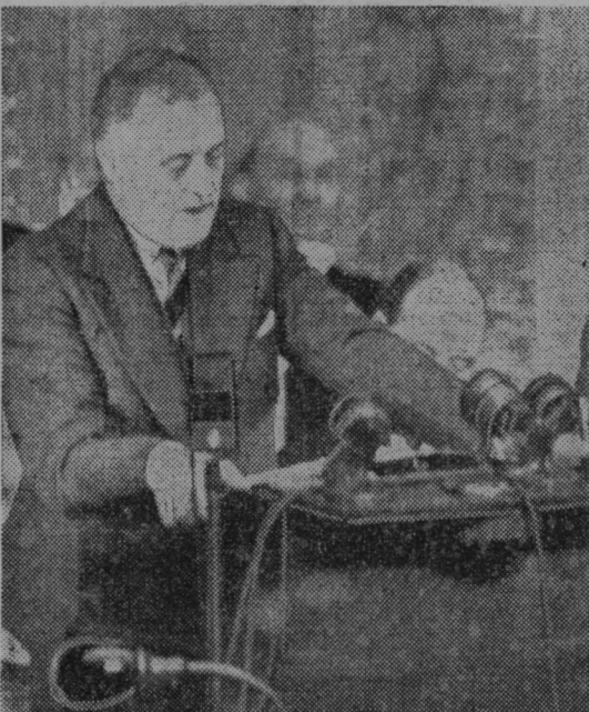
Predsednik Združenih držav Severne Amerike Roosevelt govori v kongresu ali parlamentu v Washingtonu.