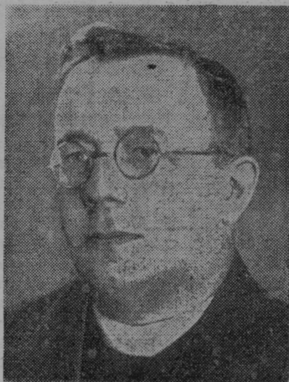
Dr. Avgustin Vološin, predsednik avtonomne vlade Karpatske Ukrajine