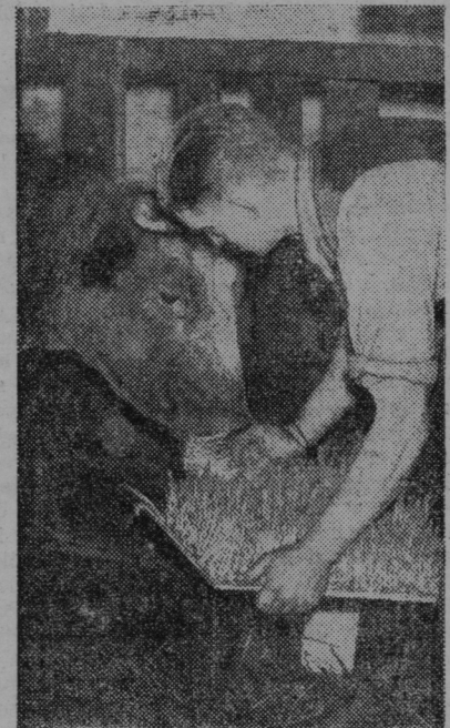
Angleški farmer je iznašel način gojitve zelenega žita v zimi s pomočjo električnega toka. Med setvijo in košnjo preteče samo devet dni. Na ta način pridelano zimsko žito krmijo kravam-mlekaricam

Sv. Barbara v Haložah. Tukajšnja podružnica Sadjarskega in vrtnarskega društva je imela deseti redni občni zbor z lepo udeležbo. Nameravano predavanje na občnem zboru je moralo izostati radi boleznih predavatelja in bo pozneje, kar bo oznanjeno pri cerkvi. Občni zbor je potekel v le-