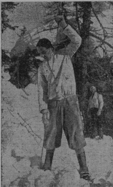
S posebnimi železnimi drogovi iščejo reševalne odprave od snežnih plazov zasute smučarske žrtve