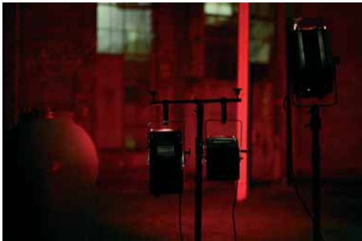
Don't Fuck with Social Democracy.

zgornjem delu odlagališča. Umetnik je o svojem projektu povedal: »Risanje na veliki površini je bilo vedno velik del otroških sanj. Predstavljajte si, da lahko rišete na hribu in pretvorite prostranstvo narave v platno; predstavljajte si, da poletite in si umetnino bolje ogledate, jo doživite kot celoto. Na to delo gledam kot na svež piš velikosti in slave, ovit v brezskrben čas.« Tako je ob koncu festivala fotograf Črtomir Goznik poletel s pilotom Albertom Benejem in ovekovečil likovno delo, ki bo