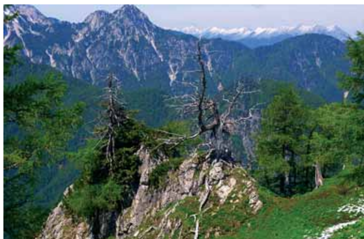
Pogled iz Strelovca.