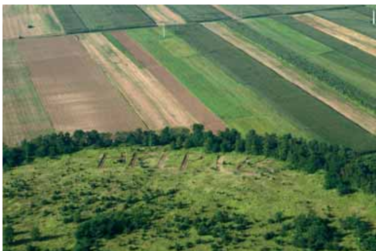
Help us.