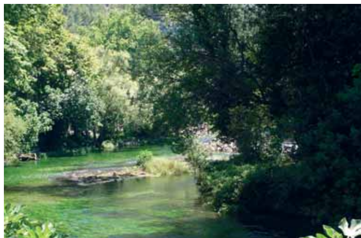
Reka Sorgue 2.