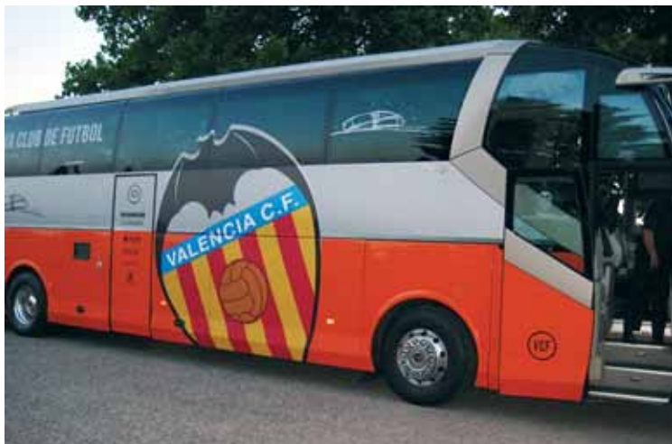
Avtobus znamenite Valencije