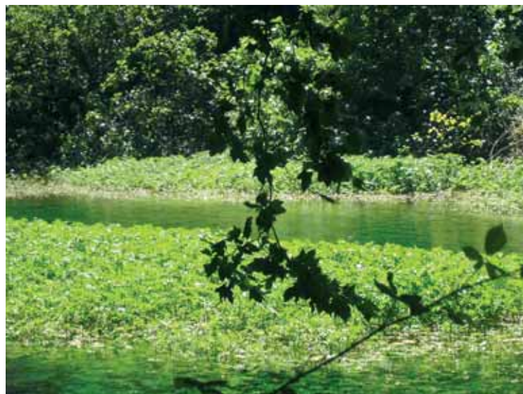
Reka Sorgue 1.