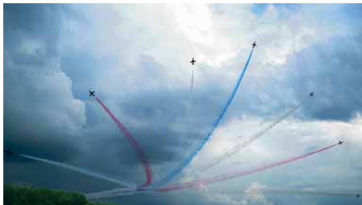
Letalski miting.