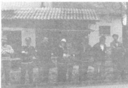
Navijač. z zanimanjem spremljajo prvo ligaško srečanje prve ekipe Horjula.

V prvi polovici maja so se začela tekmovalja v SBL – zahod in sever. Horjul v prvih dveh krogih ni imel uspeha, saj je izgubil proti 8. septembru iz Štanjela in Erasmu iz Postojne, nadaljevanje pa je prineslo veliko več, kot bi lahko pričakovali – gladki zmagi nad Anteno iz Portoroža in Plamo iz Podgrada ter v zadnjem kolu spomladanskega dela tesno zmago nad Hermesom iz Ljubljane. Tako je zdaj Horjul uvrščen na 5. mesto lestvice SBL – zahod, pri čemer zaostaja 2 točki za vodčim Jadrantom in točko za 8. septembrom, medtem ko imata 3. Hrast in 4. Erazem enako število točk. Vsekakor lep uspeh za tekmovalce brez izkušenj s podobnih tekmovalj.