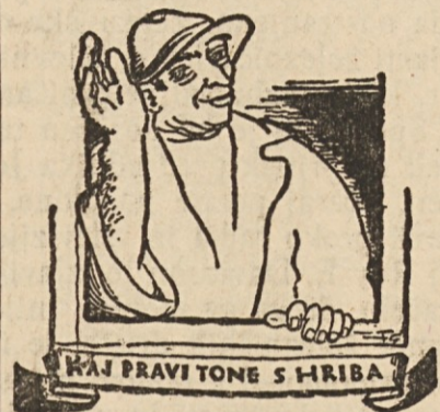
Kaj pravi tone s hriba

je in jih ocenjuje po svoje. Kdor sodi, ocenjuje prav ali napačno, to je druga zadeva in o tem bi se dalo marsikaj povedati. Malokdo je v vseh slučajih in zadevah pravilen. Na vse to je treba pomisliti, predno delamo o drugih razne sodbe, ocenitve in zaključke.