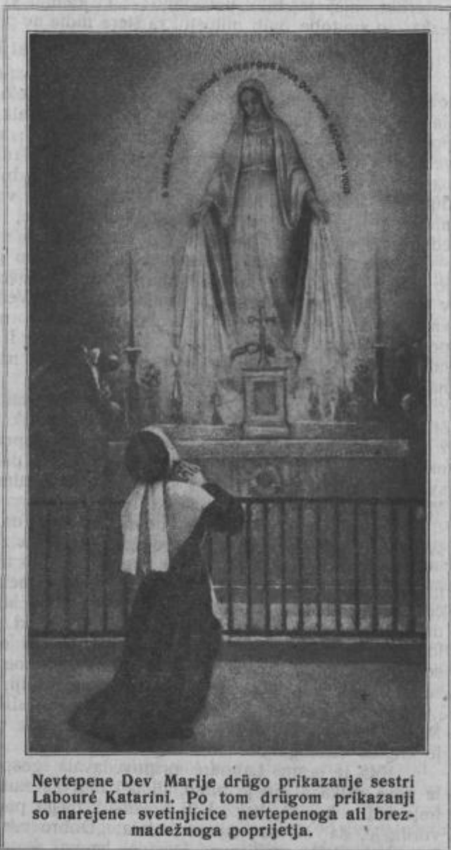
Nevtepe Dev Marije drügo prikazanje sestri Labouré Katarini. Po tom drügom prikazanji so narejene svetinjice nevtepenoga ali brezmadežnoga poprijetja.

Predstojnica, šteroj je sestra Labouré tüdi zavüpala svojo skrivnost, je štela spuniti srčno želo svoje častitlive sestre i dati napraviti podobo brezmadežne Device z zemelskov oblov. Pitala jo je zato, ali