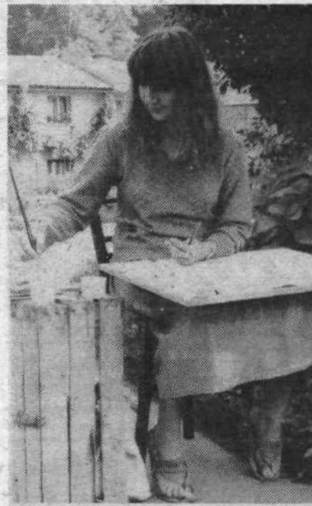
Mladim slikarjem je vse prišlo prav, tudi zabojček z dvorišča. Stol pa si je dekletke sposodilo kar pri najbližji hiši v Gameljah.