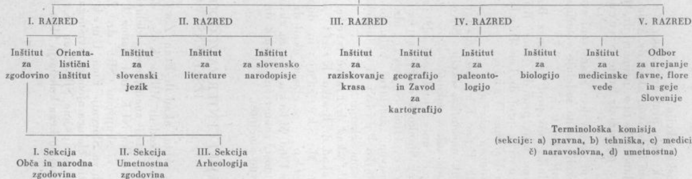
Preglednica organizacije Slovenske akademije znanosti in umetnosti