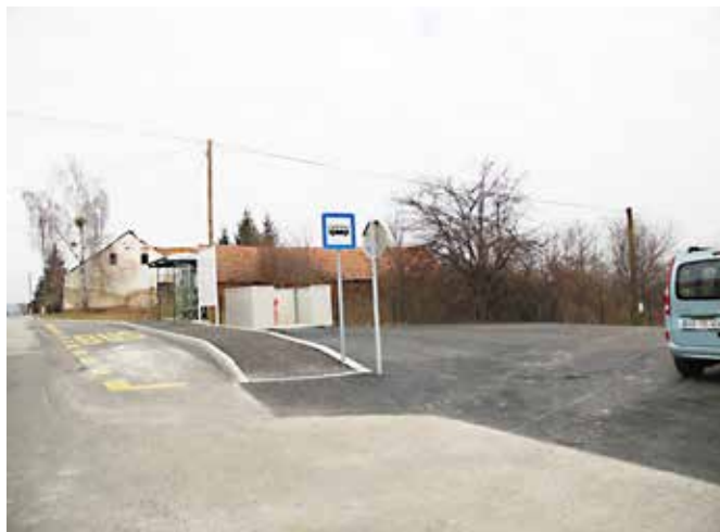
Urejeno avtobusno postajališče Fokovci.