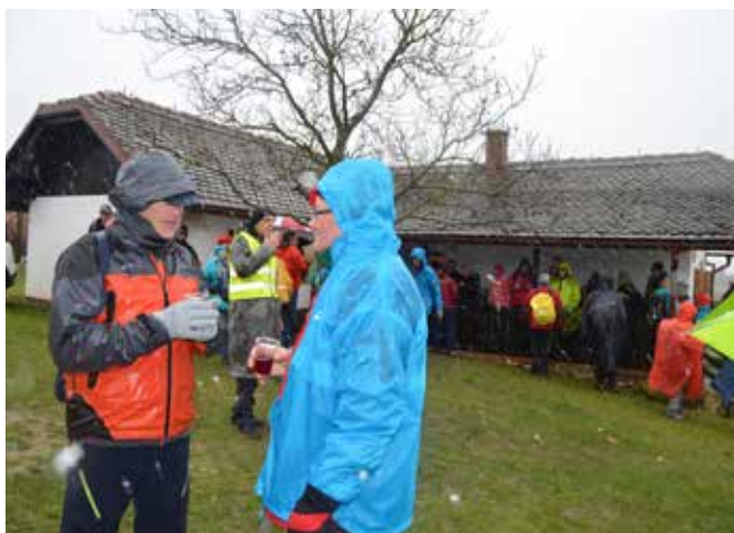
Segreli smo se ob kozarčku vina.