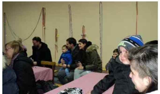
Nekateri z jokom, nekateri pa z velikim veseljem zrejo v Miklavža in njegovega spremljevalca vraga.