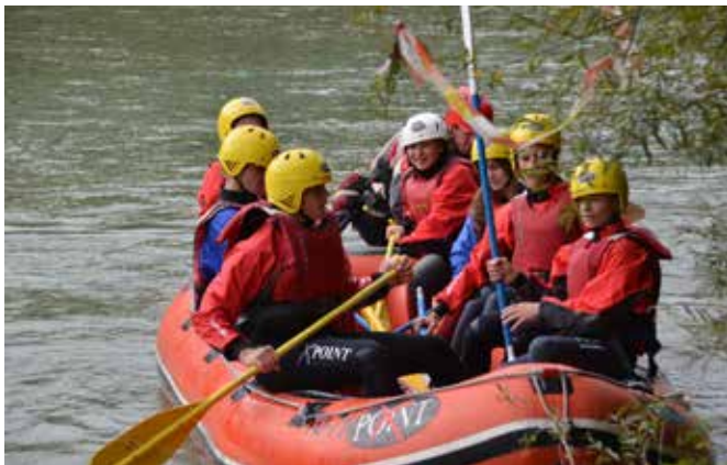
Za najbolj pogumne spust po reki Soči / A legbátrabbak raftinggal ereszkedtek le a Soča folyón