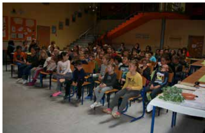
Udeleženci recitacijskega tekmovanja iz madžarščine / A magyar nyelvű szavalóverseny résztvevői