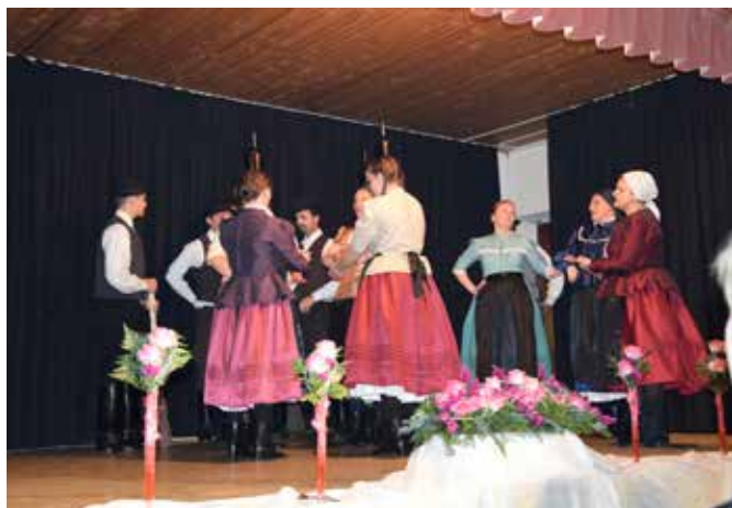
Ena izmed nastopajočih skupin / A fellépők egy csoportja a színpadon