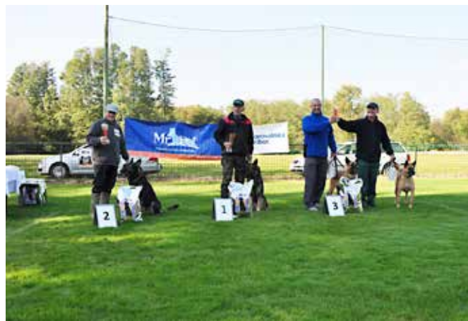
Zmagovalci tretjega državnega tekmovanja v sledenju s svojimi psi sledarji.