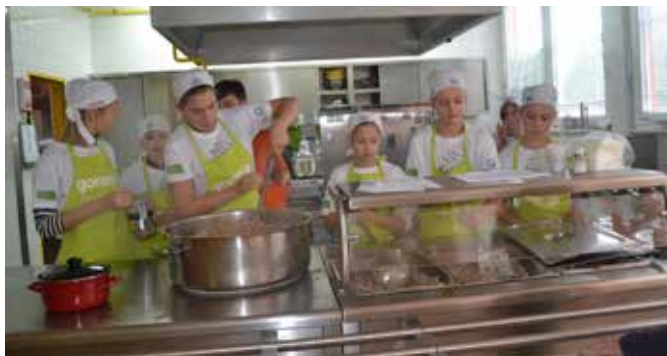
Tako izgleda, ko se stvari lotimo čisto resno.

in rezali zelenjavo za oženjeno ajdovo kašo. Na kocke so narezali tudi slanino. Za ajdove rezine so naribali čokolado. Po tej predpripravi so se preselili v kuhinjo, kjer so pričeli s kuhanjem oženjene ajdove kaše in s peko peciva. Pri delu jim je bil v veliko pomoč naš šolski kuhar. Z njegovo pomočjo je bilo kosilo pravočasno pripravljeno in malo pred dvanajsto uro so prišli prvi lačni na kosilo. Izdaja kosila je potekala brezhibno. Postavitev na krožnikih je bila takšna, kot so si jo zamislili Mladi kuharji. Za Mlade kuharje je bila to neprecenljiva izkušnja. Spoznali so, da je delo zanimivo, a zahteva veliko spretnosti in zbranosti.