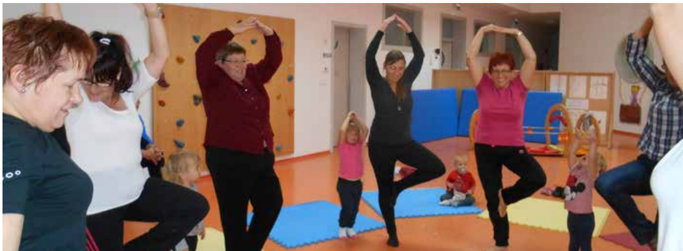
Izvajamo jogo in se zabavamo.