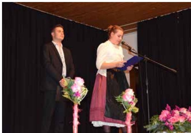
Kultúra in tradicija na odru, v preobleki, plesu in govoru / Kultúra és hagyományok viseletben, táncban és szóban