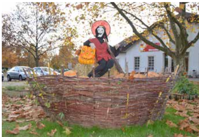
Čarovnico smo posadili v svojo košaro.