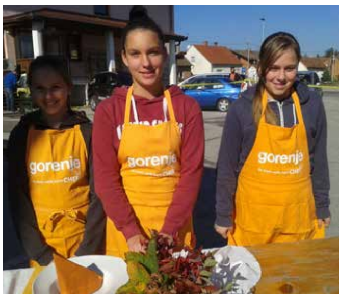
Ekipa, ki je zasedla drugo mesto v kuhanju jesenske enolončnice.