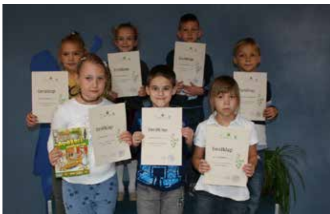
Nekateri izmed učencev s svojimi priznanji / A tanulók egy csoportja az elismerésekkel