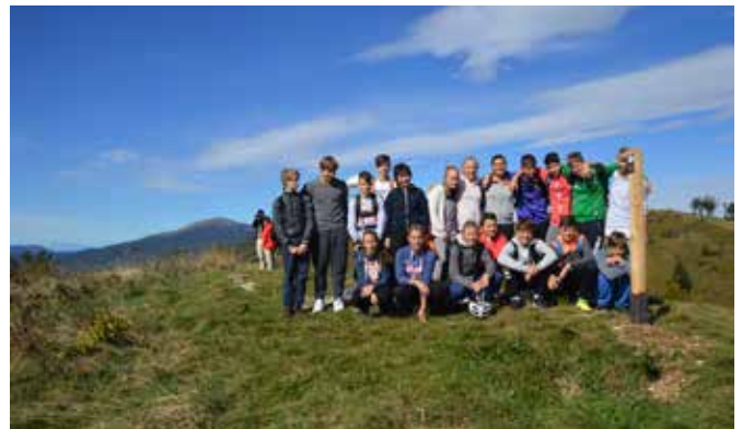
Udeleženci šole v naravi / Az „Iskola a természetben” című tanulmányi hét résztvevői