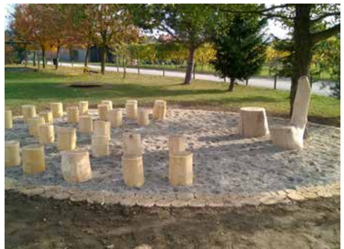
Nova šolska učilnica na prostem.