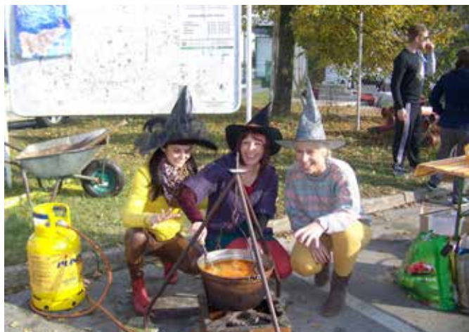
Jesenska compnija v Bogojini – kuhanje enolončnice.