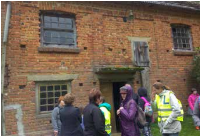
Ogled mlina, ki je nekoč res ropotal, danes pa je le še za spomin.

Tematika opozarja na ogroženo podeželsko in industrijsko dediščino. Poigrali so se tudi z besedami v besedah. Z besedama IŠČI in OKO (DEDIŠČINA OKOLI NAS) nagovar-