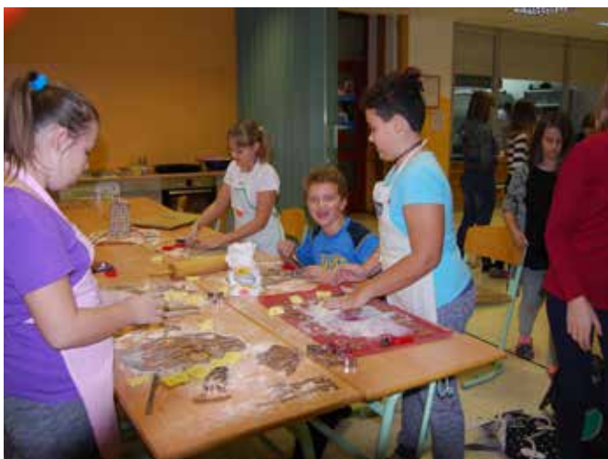
Peka keksov, da nam bo na božičnem bazarju tudi sladko.