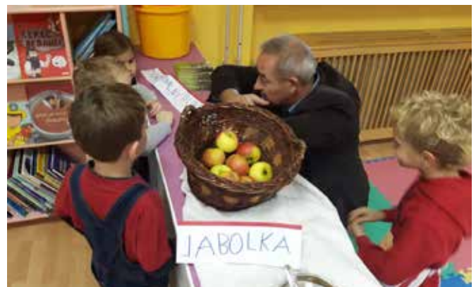
Skupaj spoznavamo in jemo domačo pridelano hrano.