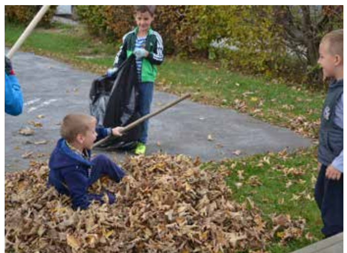
Tudi zabave ne sme manjkati – tako je delo lažje in lepše.