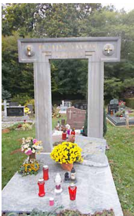
Nagrobni spomenik – vrata v lepšo prihodnost.