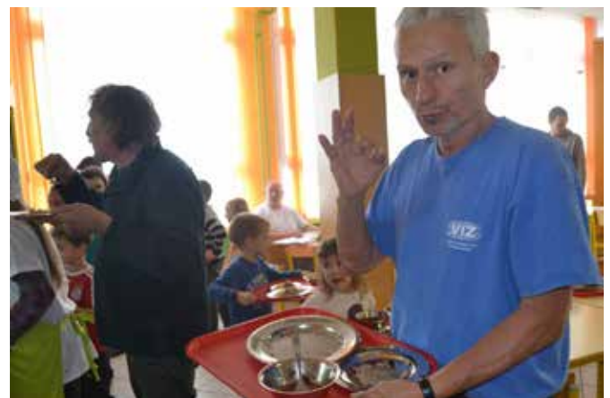
Navdušeni učitelji, v ozadju pa lačna usta.