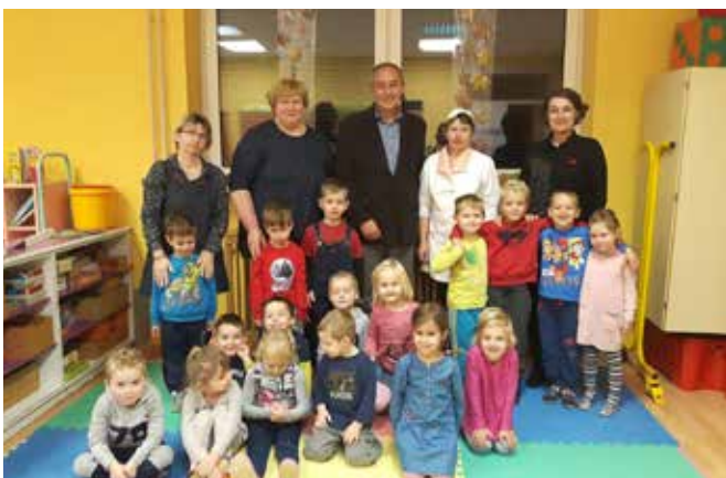
Skupinska fotografija za dolg in lep spomin.

Z otroci smo se pogovarjali o tradiciji in tradicionalni hrani. Pripravili smo pogrinjek ter k mizi povabili župana in ravnateljico. Pri zajtrku je potekal pogovor o hrani, ki smo jo imeli