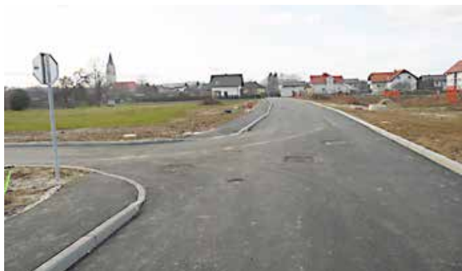
Urejen južni del območja Močvar.

V letošnjem letu je bilo zaključeno opremljanje južnega dela stavbnega zemljišča »Močvar« v Moravskih Toplicah. Zgrajena je bila asfaltirana cesta širine 5 m in dva kraka širine 3,60 m, v skupni dolžini cca 220 m. Ob cesti je bila zgrajena javna razsvetljava, vodovod, meteorna in fekalna kanalizacija, na daljšem delu ceste tudi enostranski pločnik. Ponudnik telekomunikacijskih storitev je ob tem vgradil cevi za bodoče optično omrežje.