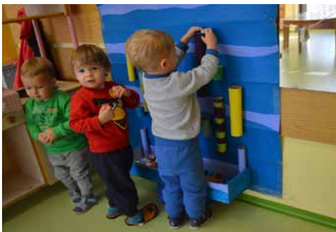
Veseli otroci z novim učnim in igralnim pripomočkom.

V kombiniranem oddelku enote Martjanci je 16 otrok. Delo vseskozi prilagajamo značilnosti skupine. Pogosto otrokom ponudimo tudi nestrukturirane materiale, s pomočjo katerih rešujejo različne izzive. Pomembno je, da so otroci vklju-