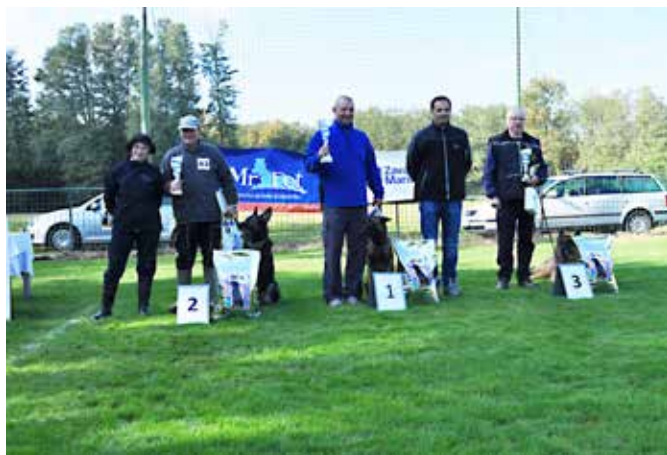
Prvouvršeni v tekmovanju v sledenju.