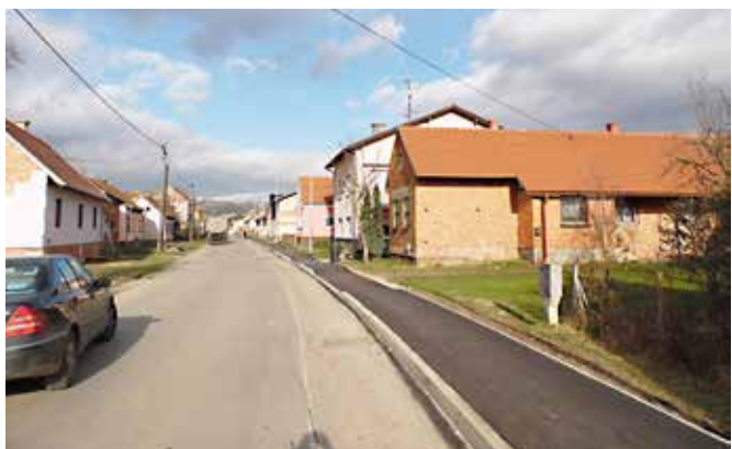
Pločnik v Bogojini.

V sredini leta so se v naselju Bogojina pričela dela na izgradnji enostranskega pločnika širine 1,60 m z javno razsvetljavo, v skupni dolžini cca 960 m. Pretežni del vseh pogodbenih del je bil predviden za izvedbo do konca septembra 2016. Rok za dokončanje vseh pogodbenih del je konec junija 2017. Dogovorjena dela za letošnje leto so bila že izvedena v mesecu septembru, vendar je bilo na željo naročnika z izvajalcem dogovorjeno, da se v letošnjem letu izvedejo tudi tista dela, ki so predvidena za naslednje leto. Okoliščine so nanesele, da je bilo povpraševanje po asfaltih v zadnjih dveh mesecih občutno večje od sposobnosti izvajalcev asfaltnih del na našem območju, zato je prihajalo in še prihaja do težav pri usklajevanju pripravljavcev podlage in asfalterjev. Vzporedno z izgradnjo pločnika so bile zamenjane starejše cevi javnega vodovoda.