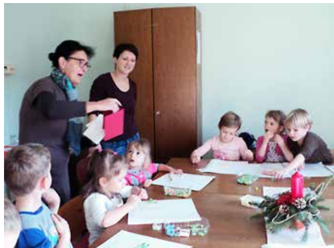
Ustvarjalnost otroških ročic.