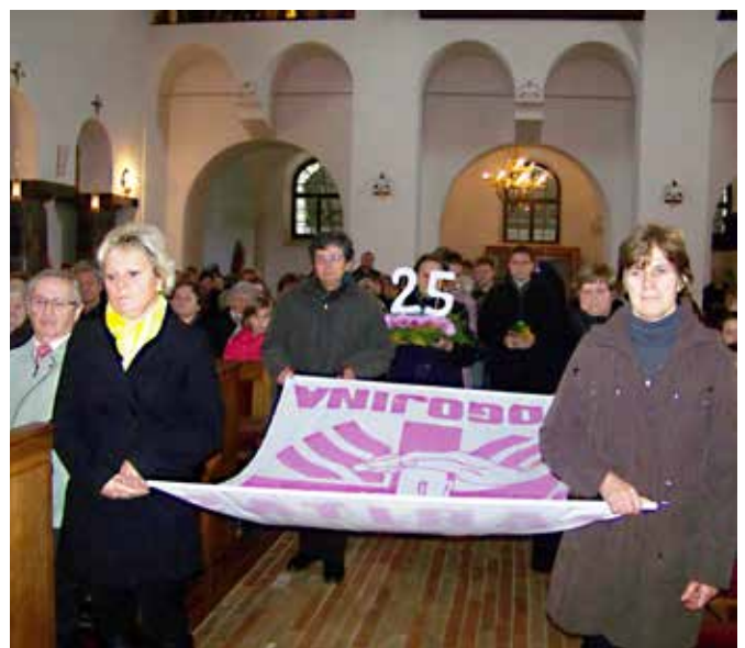
Praznovanje 25-letnice Župnijske Karitas Bogojina.