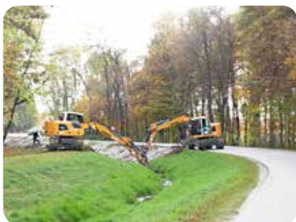
V Moravskih Toplicah so se odločili obnoviti potok Lipnico, da ne bi spomladi prišlo do poplav.