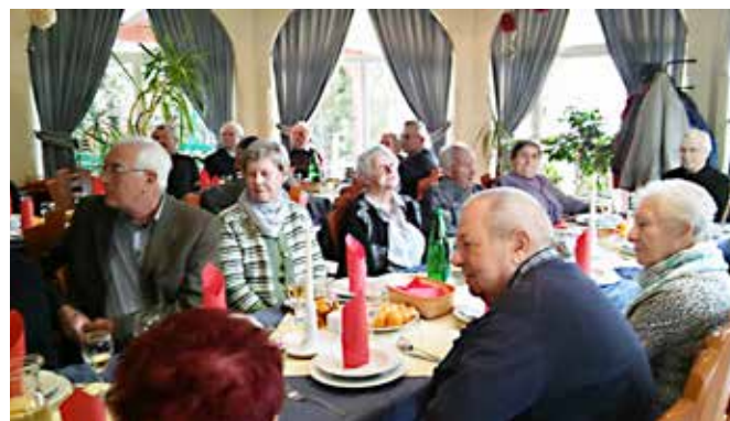
Srečanje vaščanov Moravskih Toplic.