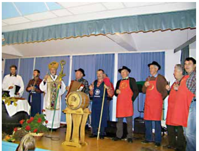
Člani VSD Filovci so na oder za krst mošta prinesli mošt, ki ga je škof sv. Martin spremenil v vino.