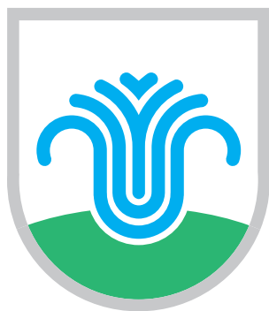
Nov grb Občine Moravske Toplice.

Grb, avtor katerega je Srečko Merklin iz Murske Sobotice, je po obliki polkrožni ščit v treh heraldičnih barvah (modra – čast, slava, poštenost, zvestoba in trajnost, zelena – zdravje, svoboda, veselje, upanje in siva/srebrna – čistost, nedolžnost, modrost). Centralna likovna figura grba je vrelec zdravilne vode. Zdravilna termalna voda, naraščajoča iz zemlje, je simbol in temeljni tvorec uspešnega turističnega in gospodarskega razvoja občine. Modri stilizirani curki vode, ki v različnih plasteh silijo vedno širše in višje, ponazarjajo moč, svežino, ekspanzijo in rast občine k nečemu še višjemu, še večjemu.