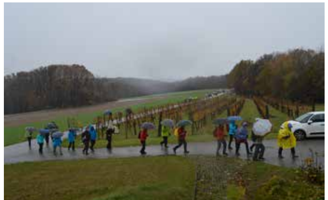
Kljub slabemu vremenu se najbolj trdoživi niso dali ugnati!

Drugo leto se spet vidimo na martinovo soboto, ki bo 11. novembra 2017!