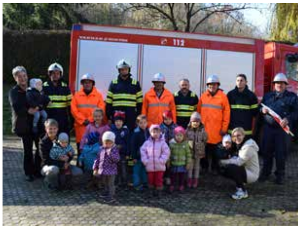
Prisotni pri evakuaciji / A kiűrtés résztvevői