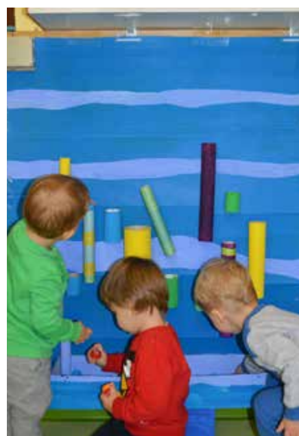
Radovedno raziskovanje in matematično ugotavljanje.

čeni v pripravo dejavnosti oz. didaktičnega materiala, saj to bistveno pripomore k motivaciji za delo. Pri izdelavi igre s tulci so otroci pomagali pobarvati karton, škatlo, tulce ter jih tudi oblepili s papirjem, prinesli pa so tudi zamaške od doma. Vse skupaj smo pritrdili na kartonsko podlago in povabili otroke k igri. Tulci in zamaški so glede na dolžino,