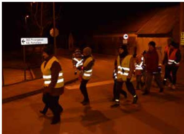
Otroci in odrasli varni v prometu / Gyerekek és felnőttek biztonságban az úton