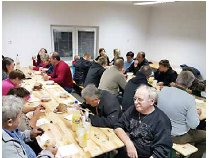
Kostanjevega piknika so se udeležili mnogi sladokusci kostanjev in pivci dobrega mošta / A gesztenyepikniken sok gesztenyekedvelő és mustkóstoló vett részt

Miközben sütöttük a gesztenyét, megkóstoltuk az idei mustot is. Ezen a napon a neves harangláb mindkét harangja megszólal. Régebben ez a szokás a környező falvakban is élt, mi pedig hűségesen ápoljuk. Minden közösség számára fontos, hogy kötődjék saját múltjához, mivel ebben találja meg mai létezésének értelmét és célját.