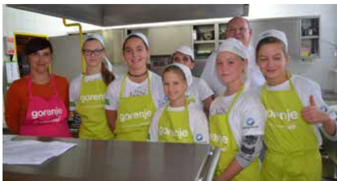
Ekipa Mladi Kuharji, ki je navdušila s čisto slovenskim kosilom.

K ajdovi kaši ponudimo solato. Ob kaši smo tokrat jedli solato rdeče pese.