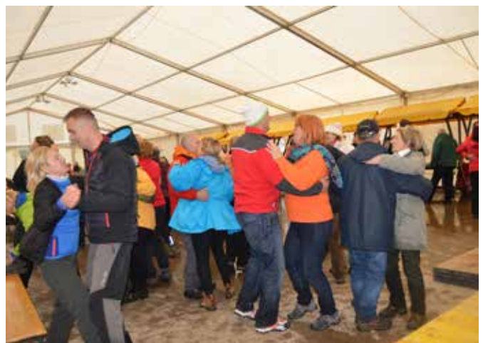
Prijetno druženje smo zaključili s plesom.