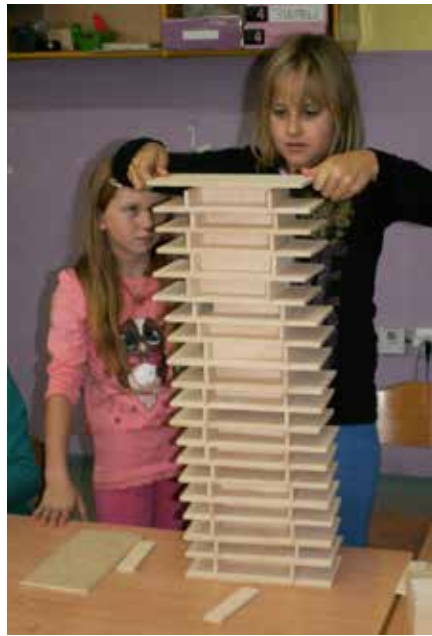
Pri takšnem ustvarjanju je potrebno imeti čim več koncentracije.

jajo javnost, da bomo dediščino iskali z budnim očesom in, da je treba dediščino spoznavati z vsemi našimi čutili. Učenci šole, njihovi starši, predstavniki Centra arhitekture Slovenije, nekaj učencev in dijakov Unesco šol z mentorji ter delavci naše šole smo po kratki predstavitvi ciljev in teme tehniškega dne ustvarjali v delavnicah in po končanem delu razstavili svoje izdelke v šolski jedilnici in pripravili kratek kulturni program.