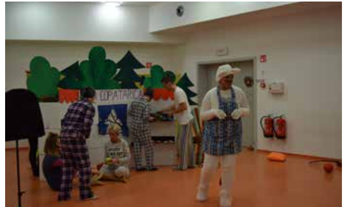
Muca Copatarica v izvedbi strokovnih delavcev Vrtcev OMT.