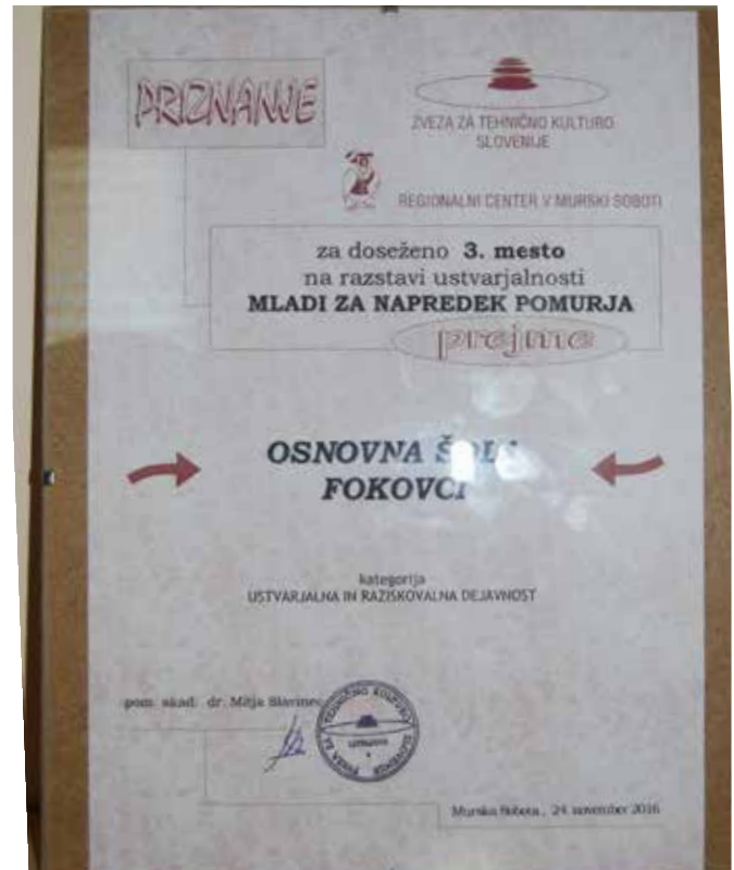
Priznanje, ki smo ga prejeli.