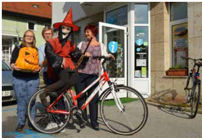
Zaplesene na TIC OMT se niso mogle upreti fotografiranju s čarovnico.

Pokvarilo se ji je čarovniško prevozno sredstvo, zato si je čarovnica prišla izposoditi kolo v TIC Moravske Toplice, kjer je mimogrede dobila tudi navodila za svoj enotedenski »halloween« delovni počitek pred marketom Mercator. Trenutno je aktualna decembrska praznična dekoracija. Je tudi vam všeč?