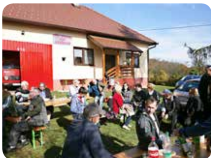
V Kančevcih smo v nedeljo, 23. oktobra 2016, pripravili vaški piknik. Z vaščani in ostalimi povabljenici smo ob hrani, pijači in kostanjih preživeli lep jesenski dan.