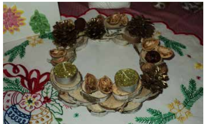
Eden izmed adventnih venčkov, ustvarjenih izpod spretnih rok članic TD Martin.