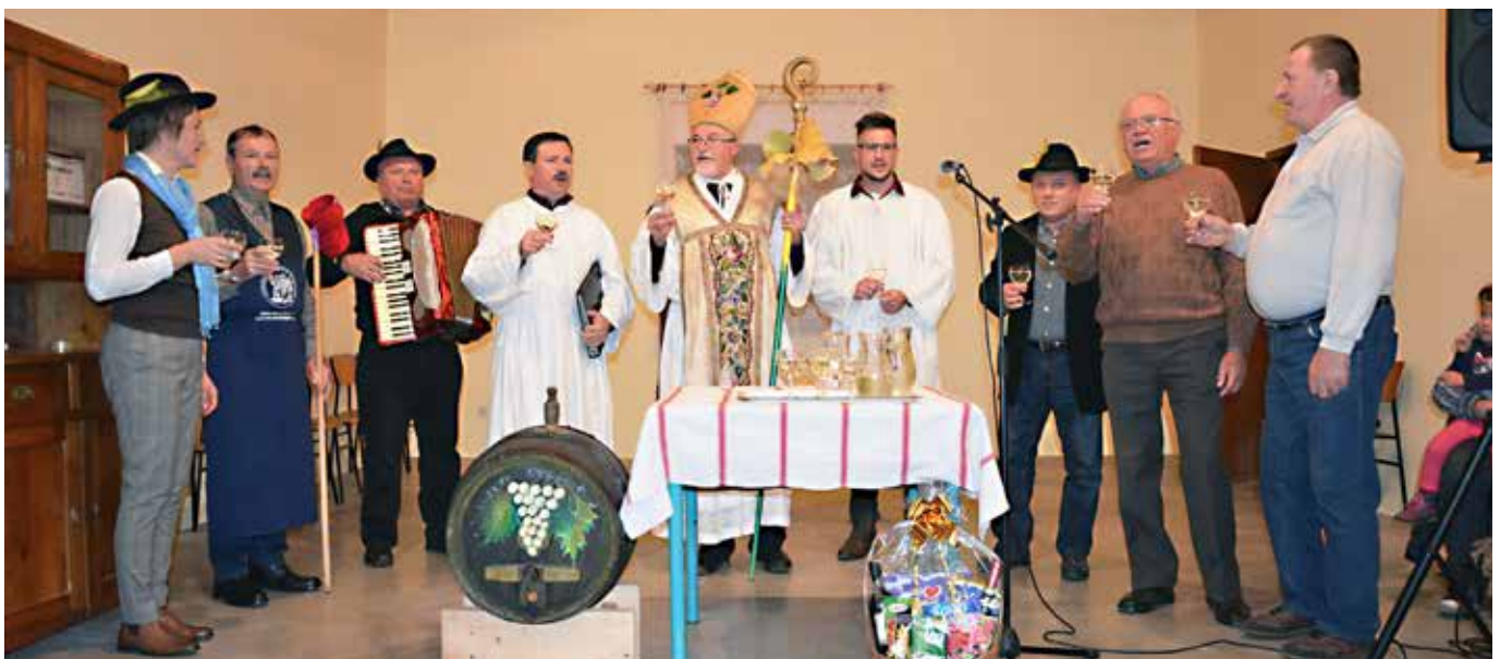
Tako izgleda 7. tradicionalno praznovanje mladega vina / Ilyen volt a 7. hagyományos újborünnep

Hogy ne menjen feledésbe a mezei munkák befejezését és az újbor keresztelését jelképező régi népi ünnep, a pártosfalvi Ady Endre Művelődési Turisztikai Egyesület borászati szekciója 2016. november 12-én, szombaton, immár hetedik alkalommal megszervezte az immár hagyományos Márton napi rendezvényt. A műsorban fellépett az egyesület női kórusa, és a dobronaki idegenforgalmi egyesület vicces mustkeresztelőt tartó csoportja.