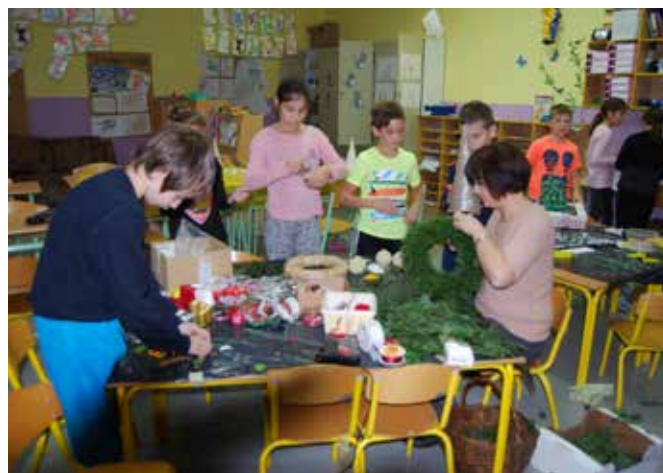
Izdelava adventnih vencev in novoletnih okraskov, da bomo lahko na bazarju čim več prodali.