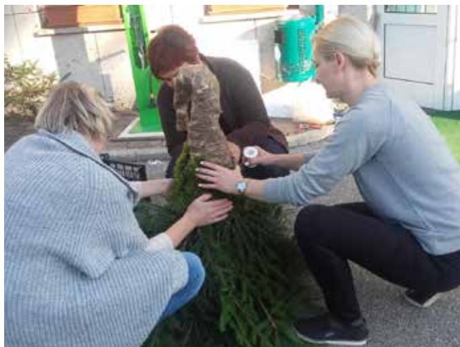
Izdelovanje dekoracije za adventno košaro.