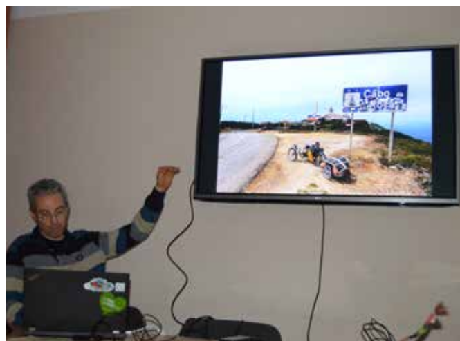
Razlagamo in razkazujemo dogodivščine.