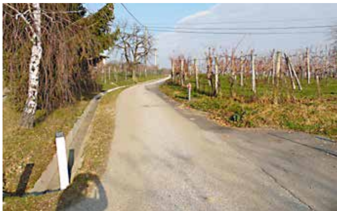
Nov vodovod v delu Ivanovcev.

V fazi priprave projekta pomurskega vodovoda je Občina Moravske Toplice uvrstila v pripravo tudi vodovode za naselja Ivanovci in Kančevci. Po racionalizaciji projekta s strani države je nekaj naselij izpadlo iz prve faze, med njimi tudi del naselja Ivanovci in naselje Kančevci. Ker pa je bil projekt zasnovan tako, da je transportni vod, po katerem se dobavlja voda za sosednje občine, zgrajen ob cesti Sebeborci-Panovci, je bilo smiselno, da se z vodo oskrbi tista območja, ki ležijo neposredno ob navedenem transportnem vod. Zato se je občina odločila z lastnimi sredstvi zgraditi vodovod na navedenih območjih. Tako je bilo v obeh naseljih skupaj zgrajeno cca 3 km vodovoda.