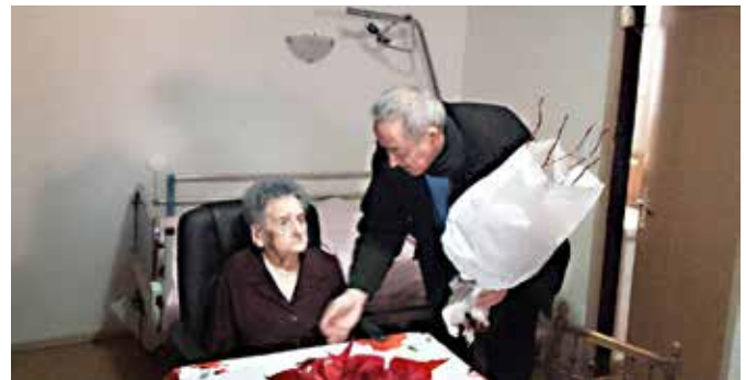
Župan ji je ob obisku prinesel rože in ji čestital za 105. rojstni dan.