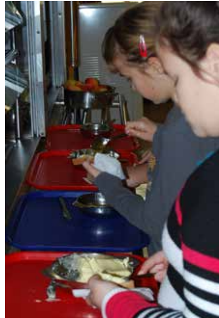
Mažemo maslo na kruh in dodajamo med.

več živil pridobiti od domačih – slovenskih proizvajalcev. Učence skozi celo leto preko različnih aktivnosti pri pouku, pri dnevih dejavnosti in tudi v prostem času spodbujamo k uživanju svežega sadja in zelenjave ter k aktivnemu preživljanju prostega časa. Tradicionalni slovenski zajtrk je že utečena aktivnost, ko vsaj enkrat v šolskem letu otroci zjutraj pred poukom zaužijejo obrok, ki je sestavljen iz domačih živil –