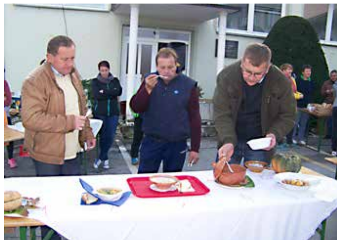
Ocenjevanje jesenske enolončnice.