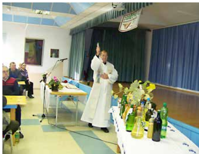
Martinova nedelja v Filovcih.