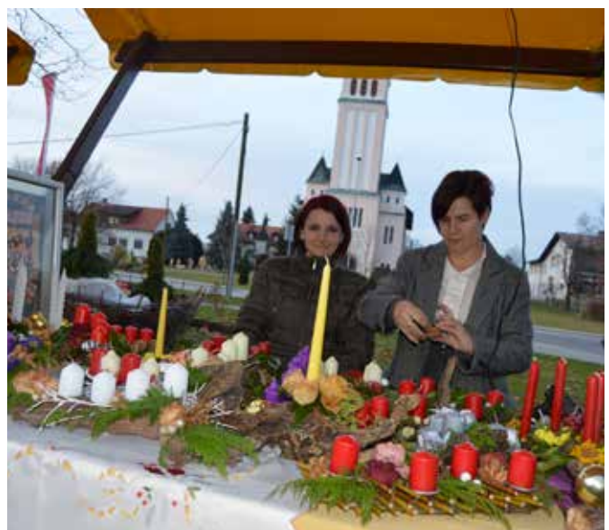
Na adventnem sejmu pred trgovino Mercator v Moravskih Toplicah so ponudniki ponujali svoje izdelke za prihajajoči praznični čas.