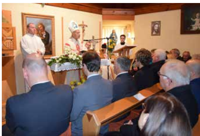
Sveta maša za pokojnega velikega človeka – Boga izbrano dušo / Szentmise a megboldogult nagy emberért – Istentől kiválasztott lélekért