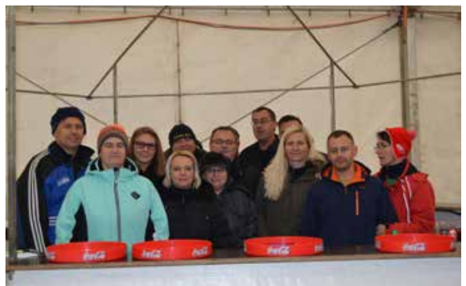
Delavci na 17. Martinovem pohodu, ki so poskrbeli za dobro vzdušje.