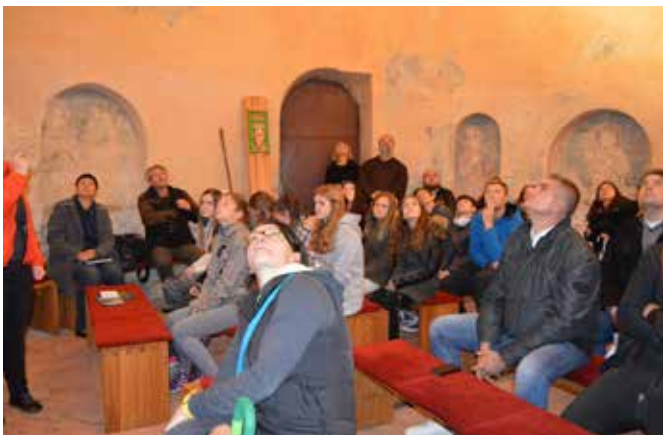
Nobenemu obiskovalcu ni ušla niti ena zanimivost.

Namen projekta je kakovostna promocija selanske rotunde skozi igro, ki cilja na dvig kakovosti posredovanja in spreje-