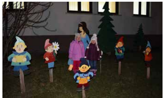
Sneguljčica in sedem palčkov – čarobno!