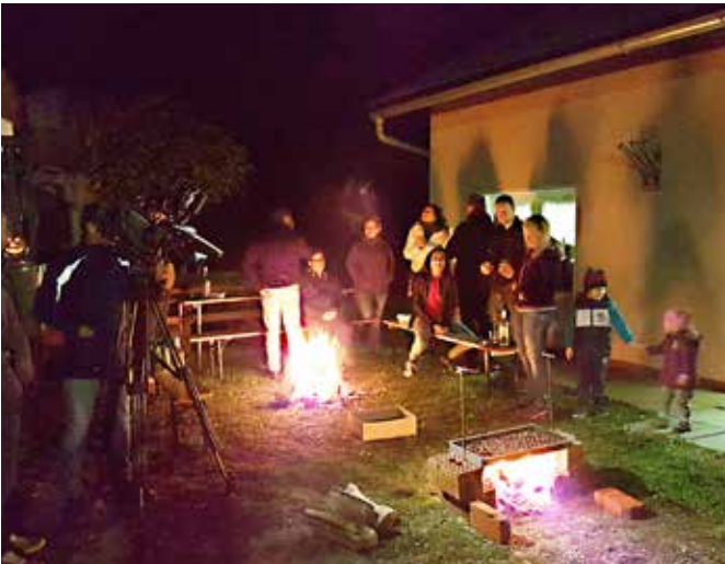
Nočno druženje in ohranjanje tradicije / Éjszakai társalgás és hagyományörzés