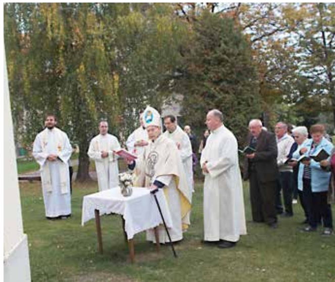
Sveta maša in blagoslov obnovljenih fresk na zunanji strani cerkve.