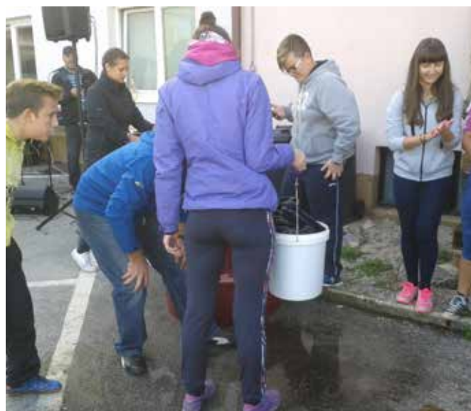
Zabava na športnih igrah.