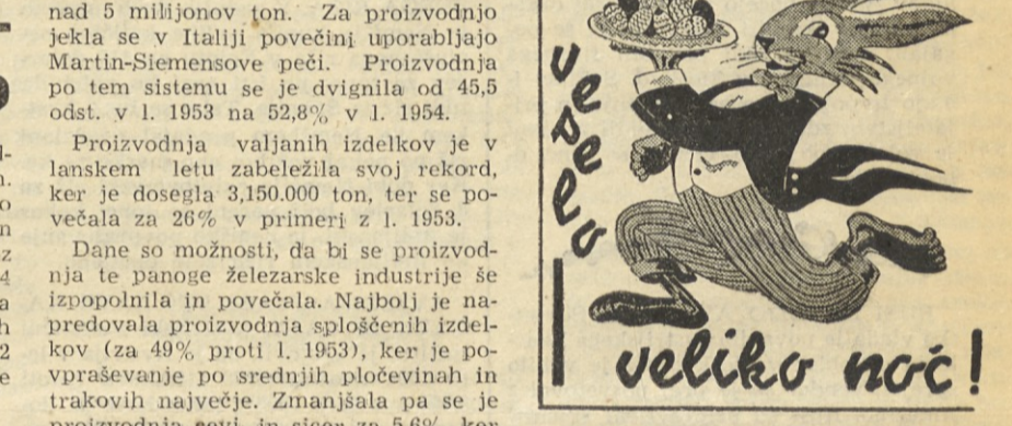
SOJIM BRALCEM IN OGLASEVAL-CEM ZELITA UREDNIŠTVO IN UPRAVA »GOSPODARSTVA«.

leta, predstavlja le 70% zmogljivosti italijanske jeklarske industrije. Da bi se vsa zmogljivost izkoristila, bi bilo potrebno znatni stroške in s tem pospešiti potrošnjo jekla, ki zdaj znaša nad 5 milijonov ton. Za proizvodnjo jekla se v Italiji povečini uporabljajo Martin-Siemensove peči. Proizvodnja po tem sistemu se je dvignila od 45,5 odst. v l. 1953 na 52,8% v l. 1954. Proizvodnja valjanih izdelkov je v lanskem letu zabeležila svoj rekord, ker je dosegla 3.150.000 ton, ter se povečala za 26% v primeri z l. 1953. Dane so možnosti, da bi se proizvodnja te panoge železarske industrije še izpopolnila in povečala. Najbolj je napredovala proizvodnja splošnih izdelkov (za 49% proti l. 1953), ker je popravševanje po srednjih pločevinah in trakovih največje. Zmanjšala pa se je proizvodnja evri, in sicer za 5,6%, ker je izvoz teh padel.