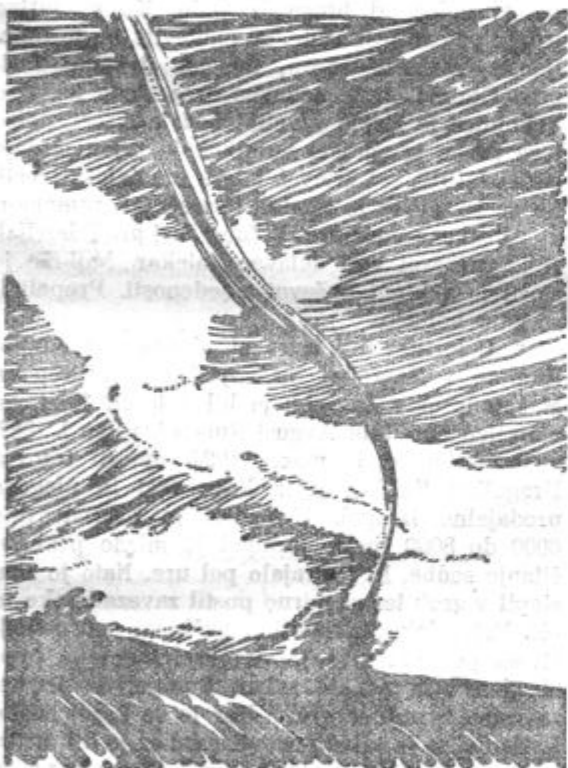
V ameriškem mestu Nebraska opazovani in fotografirani viharni oblak.