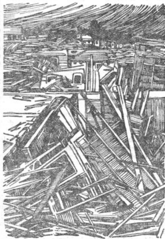
Del ameriškega mesta Murphysboro po zadnjem tornadu, ki je v tem mestu usmrtil 210 oseb in 500 ranil.

svoj avtomobil, v katerem sta sedeli njegova žena in hčerka, za odhod, da bi se rešil pred tornadom. V hipu je tornado zadel zadnji del avtomobil,