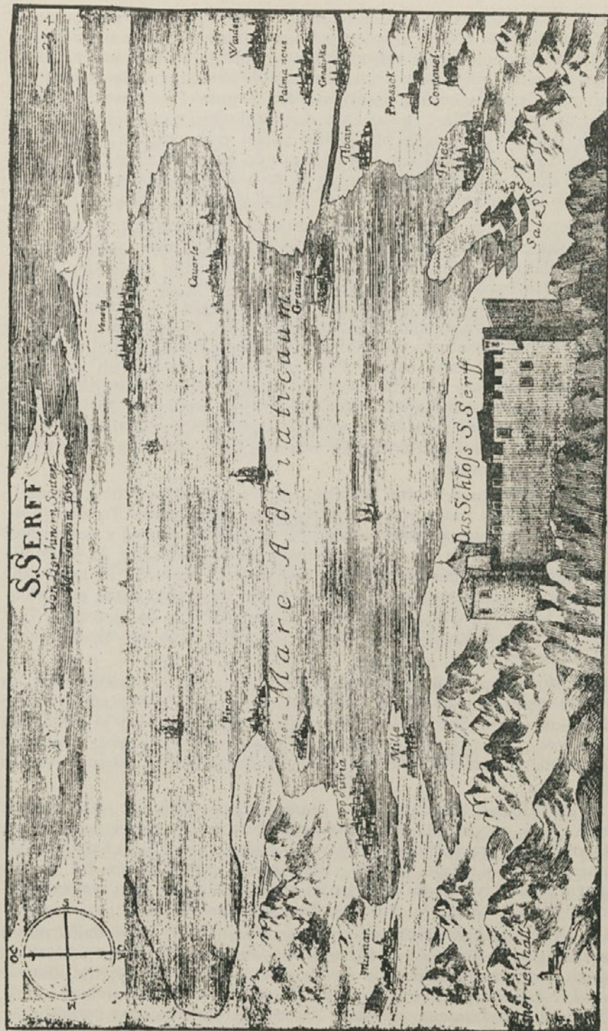
Pogled s Socerbskega gradu na Jadransko morje (po Valvazoriju, 1689)